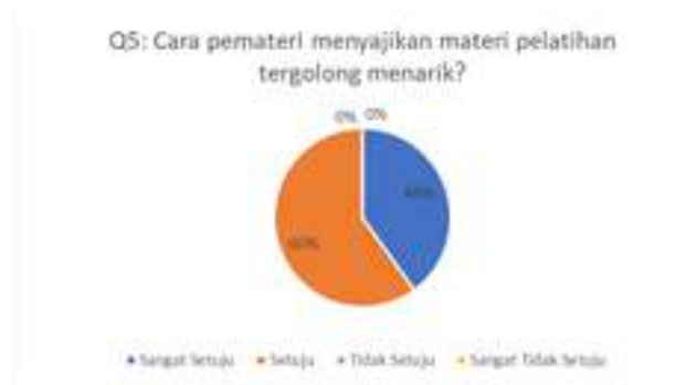
Gambar 6. Hasil Kuesioner Mengenai Cara Penyampaian Materi

Berdasarkan grafik pada gambar 6 dapat dilihat bahwa sebanyak 60% peserta menjawab setuju dan 40% peserta menjawab sangat setuju. Artinya materi telah disampaikan secara menarik oleh narasumber. Pertanyaan kuesioner keenam terkait dengan layanan yang diberikan oleh anggota pendamping pelatihan. Hasil pengisian kuesioner dapat dilihat pada Gambar 7.