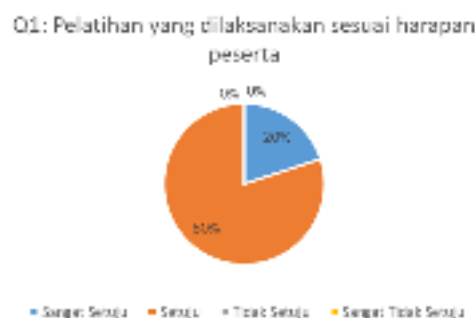
Gambar 2. Hasil Kuesioner Mengenai Kesesuaian Harapan Peserta

Pada tahap akhir program abdimas dilakukan evaluasi untuk mengukur keberhasilan atas solusi masalah yang telah disepakati dengan mitra. Evaluasi dilakukan dengan metode penyebaran kuesioner kepada peserta pelatihan. Kuesioner yang disebarkan bersifat tertutup [15] yang terdiri dari 12 pertanyaan. Dimana pertanyaan-pertanyaan kuesioner dirancang untuk dapat menunjukkan keberhasilan dari solusi yang ditawarkan, menunjukkan luaran dari solusi, dan mengetahui faktor-faktor apa saja yang menjadi pendorong atau penghambat pelaksanaan program pengabdian masyarakat. Pertanyaan pertama mengenai kesesuaian pelatihan yang dilaksanakan terhadap harapan peserta. Hasil pengisian pertanyaan pertama dapat dilihat pada Gambar 2.