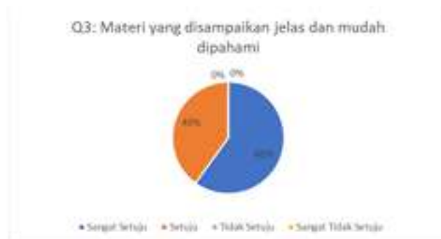
Gambar 4. Hasil Kuesioner Mengenai Kejelasan dan Pemahaman Materi

Berdasarkan grafik pada gambar 3 dapat dilihat bahwa sebanyak 60% menjawab setuju dan 40% menjawab sangat setuju. Artinya materi yang disampaikan sudah sesuai dengan kebutuhan peserta pelatihan. Pertanyaan kuesioner ketiga terkait dengan kejelasan dan pemahaman materi yang disampaikan kepada peserta pelatihan. Hasil pengisian kuesioner dapat dilihat pada Gambar 4.