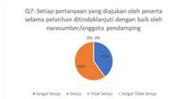
Gambar 8. Hasil Kuesioner Mengenai Tindak Lanjut Narasumber/Anggota Pendamping Terhadap Setiap Pertanyaan dari Peserta

Berdasarkan grafik pada gambar 7 dapat dilihat bahwa sebanyak 60% peserta menjawab setuju dan 40% peserta menjawab sangat setuju. Artinya layanan yang diberikan oleh anggota pendamping selama proses pelatihan sudah baik bagi peserta pelatihan. Pertanyaan kuesioner ketujuh terkait dengan tindak lanjut narasumber atau anggota pendamping terhadap setiap pertanyaan yang diajukan oleh peserta selama proses pelatihan. Hasil pengisian kuesioner dapat dilihat pada Gambar 8.