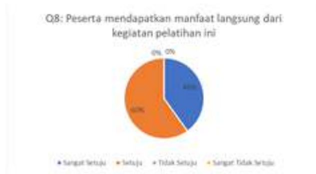
Gambar 9. Hasil Kuesioner Mengenai Manfaat Langsung dari Kegiatan Pelatihan

Berdasarkan grafik pada gambar 9 dapat dilihat bahwa sebanyak 60% peserta menjawab setuju dan 40% peserta menjawab sangat setuju. Artinya peserta pelatihan merasa ada manfaat secara langsung dari kegiatan pelatihan yang dilakukan. Pertanyaan kuesioner sembilan terkait dengan keberhasilan kegiatan pelatihan apakah dapat menambah pengetahuan peserta pelatihan. Hasil pengisian kuesioner dapat dilihat pada Gambar 10.