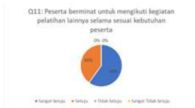
Gambar 12. Hasil Kuesioner Mengenai Tingkat Minat Peserta untuk Mengikuti Kegiatan Pelatihan

Pertanyaan kuesioner dua belas terkait dengan tingkat kepuasan peserta terhadap kegiatan pelatihan yang dilakukan. Hasil pengisian kuesioner dapat dilihat pada Gambar 13.