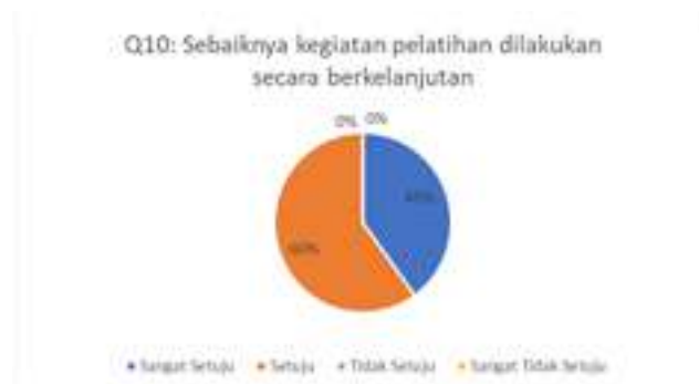
Gambar 11. Hasil Kuesioner Mengenai Keberlanjutan Kegiatan Pelatihan

Berdasarkan grafik pada gambar 10 dapat dilihat bahwa sebanyak 20% peserta menjawab setuju dan 80% peserta menjawab sangat setuju. Artinya peserta pelatihan merasa kegiatan pelatihan berhasil menambah pengetahuan baru tentang penggunaan Powerpoint untuk dapat diterapkan dalam pembuatan bahan ajar. Pertanyaan kuesioner sepuluh terkait dengan keberlanjutan kegiatan pelatihan apakah dapat dilakukan. Hasil pengisian kuesioner dapat dilihat pada Gambar 11.