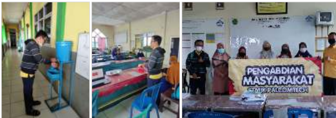
Gambar 1. Kegiatan Pelatihan

Kegiatan pelatihan dilakukan dengan metode workshop [13], pelatihan dilakukan selama satu hari pada Senin, tanggal 8 Februari 2021. Pelatihan dimulai pada pukul 08:00 sampai dengan 14:00 berlokasi di Sekolah SMK Nurul Iman Palembang. Materi Powerpoint yang disampaikan menitik beratkan pada penggunaan grafis dan animasi pada bahan ajar, seperti: pemilihan font , tata letak ( layout ), penyisipan gambar, pemilihan warna, pembuatan animasi sederhana dan video. Dimana peserta pelatihan adalah tenaga pendidik yang berjumlah lima orang. Jumlah peserta pelatihan merupakan perwakilan yang dipilih oleh Kepala Sekolah dari tenaga pendidik yang ada, dan peserta pelatihan ditugaskan oleh Kepala Sekolah agar dapat mendistribusikan ilmu yang didapat kepada semua rekan tenaga pendidik di lingkungan SMK Nurul Iman Palembang. Pembatasan peserta pelatihan ini juga dalam rangka menerapkan Protokol Kesehatan untuk menghindari kumpulan peserta pelatihan yang banyak di masa Pandemi Covid-19, karena pada kegiatan pelatihan ini tetap menerapkan Protokol Kesehatan 3M yaitu memakai masker, mencuci tangan, menjaga jarak dan menghindari kerumunan [14]. Kegiatan pelatihan dapat dilihat pada Gambar 1.