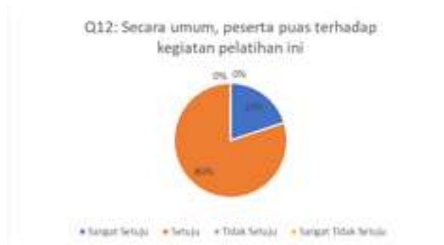
Gambar 13. Hasil Kuesioner Mengenai Tingkat Kepuasan Peserta Terhadap Kegiatan Pelatihan

Pertanyaan kuesioner dua belas terkait dengan tingkat kepuasan peserta terhadap kegiatan pelatihan yang dilakukan. Hasil pengisian kuesioner dapat dilihat pada Gambar 13.