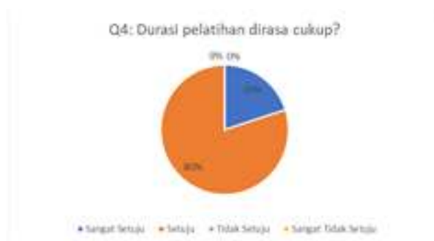
Gambar 5. Hasil Kuesioner Mengenai Durasi Pelatihan

Berdasarkan grafik pada gambar 4 dapat dilihat bahwa sebanyak 40% menjawab setuju dan 60% menjawab sangat setuju. Artinya materi yang disampaikan sudah jelas dan dapat dipahami oleh peserta pelatihan. Pertanyaan kuesioner keempat terkait dengan durasi pelatihan yang dilaksanakan. Hasil pengisian kuesioner dapat dilihat pada Gambar 5.