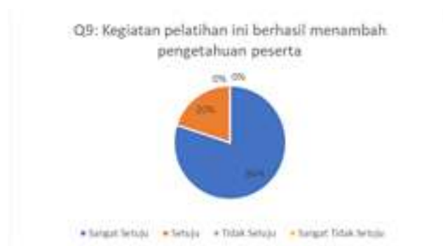
Gambar 10. Hasil Kuesioner Mengenai Keberhasilan Pelatihan dalam Menambah Pengetahuan Peserta

Berdasarkan grafik pada gambar 9 dapat dilihat bahwa sebanyak 60% peserta menjawab setuju dan 40% peserta menjawab sangat setuju. Artinya peserta pelatihan merasa ada manfaat secara langsung dari kegiatan pelatihan yang dilakukan. Pertanyaan kuesioner sembilan terkait dengan keberhasilan kegiatan pelatihan apakah dapat menambah pengetahuan peserta pelatihan. Hasil pengisian kuesioner dapat dilihat pada Gambar 10.