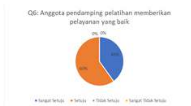
Gambar 7. Hasil Kuesioner Mengenai Layanan Anggota Pendamping

Berdasarkan grafik pada gambar 6 dapat dilihat bahwa sebanyak 60% peserta menjawab setuju dan 40% peserta menjawab sangat setuju. Artinya materi telah disampaikan secara menarik oleh narasumber. Pertanyaan kuesioner keenam terkait dengan layanan yang diberikan oleh anggota pendamping pelatihan. Hasil pengisian kuesioner dapat dilihat pada Gambar 7.