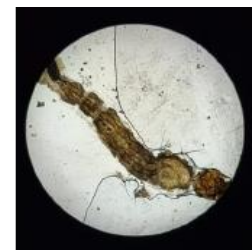
Gambar 1. Larva Instar III sebelum pemberian infusa kulit nanas