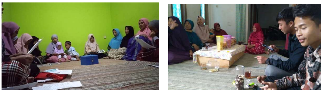
Gambar 2. Memberikan Sosialisasi Pemberdayaan Singkong

istilah-istilah yang ada dalam pemberdayaan singkong. Pada tahap ini pelaku UMKM Desa Derongisor berdiskusi dengan tim pengabdian tentang istilah-istilah yang ada pada pemberdayaan singkong dalam bisnis.