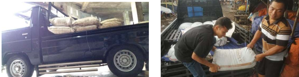
Gambar 3. Praktek dan Pendampingan Pemberdayaan Singkong