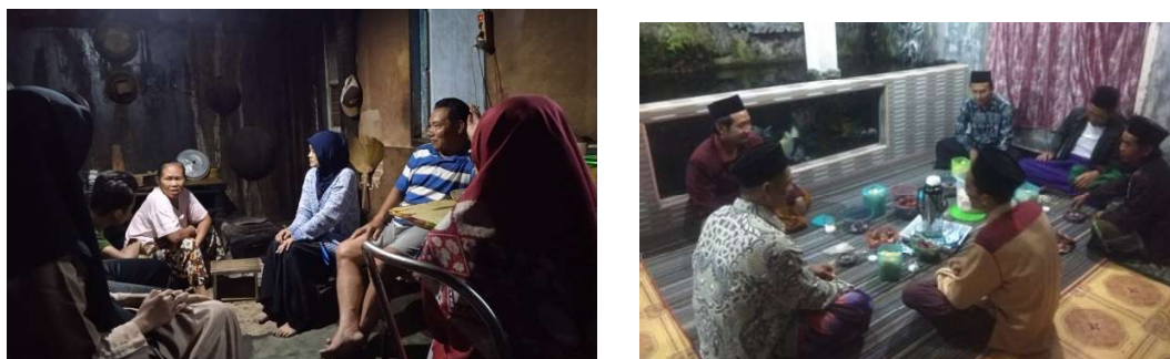
Gambar 4. Evaluasi Pemberdayaan Singkong secara door to door

Tahap terakhir adalah melaksanakan evaluasi. Tim pengabdian melakukan pengecekan terhadap pemberdayaan yang telah dilakukan oleh pelaku UMKM. Pada tahap ini tim pengabdian melakukan secara door to door di tempat usaha pelaku UMKM dengan cara memberikan masukan atau saran terhadap hasil dari pemberdayaan singkong yang dilakukan oleh pelaku UMKM.