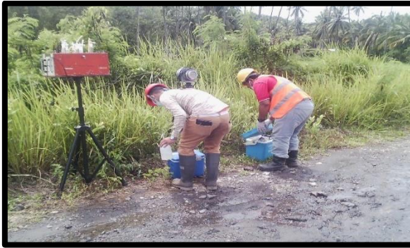
Gambar 7 Lokasi kedua (Jalan akses Desa Tawaang Timur Jaga 4)

Hasil analisa dari sampel pada lokasi kedua, disajikan dalam tabel 2 sebagai berikut: