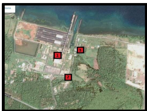
Gambar 1. Peta lokasi pengambilan sampel

Sampel yang digunakan dalam penelitian ini adalah karbon monoksida (CO), Sulfur Oksida (SO x ), Nitrogen Oksida (NO x ), Partikulat (TSP) dan Arsen (As) dalam jaringan tumbuhan yang dihasilkan dari proses pembakaran batubara di PLTU. Pengambilan sampel dilakukan secara purposive sampling dengan tiga pembebanan, yakni titik 1 berada ditapak proyek PLTU Amurang, titik 2 berada di Jalan akses menuju pemukiman warga, dan titik 3 berada di pemukiman warga Desa Tawaang Timur Jaga 4.. Pertimbangan pengambilan lokasi tersebut didasarkan oleh adanya sumber emisi, arah angin dan lokasi pemukiman warga setempat serta untuk melihat perbedaan dimasing masing titik yang telah ditentukan.