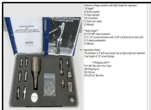
Gambar 5. Graseby Anderson

1.000.0 adalah konversi satuan dari gram ke \mu\text{g}