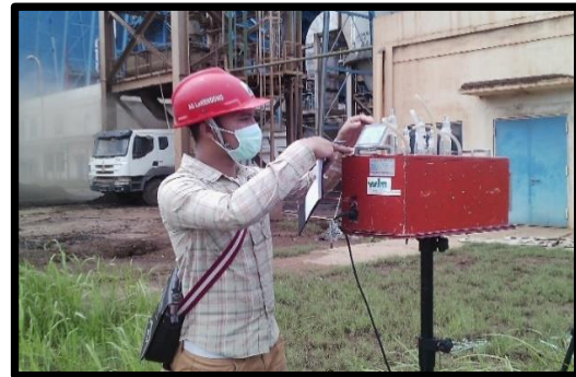
Gambar 6. Lokasi I dibawah cerobong PLTU

Lokasi I (satu) merupakan tempat pembuangan hasil akhir dari pembakaran batubara berupa debu dengan ukuran kecil (mikro). Kondisi arah angin dominan ke utara dan kecepatan angin sebesar 1,2 knot, temperatur udara 32,2^\circ\text{C} , kelembaban udara 33% dan tekanan udara 760 mmHg.