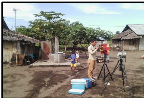
Gambar 8. Lokasi ketiga pengambilan sampel udara (Pemukiman Warga)

Lokasi III (ketiga) berada di area pemukiman warga Desa Tawaang Timur jaga 4. Arah angin ke barat dengan kecepatan angina sebesar 1,0 knot, temperature yang diukur pada saat pengambilan sampel adalah 33,1 °C dengan kelembaban udara 25% dan tekanan udara 760 mmHg.