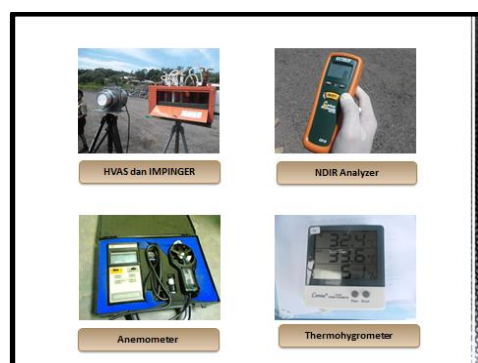
Gambar 2. Alat alat yang digunakan

Untuk pengambilan sampel gas yang dilakukan adalah memasukan masing masing 10 ml larutan penjerap absoerbent kedalam impinger dan lakukan sampling selama 1 jam dengan kecepatan udara 1-2 liter/menit. Untuk pengambilan sampel debu adalah dengan menggunakan kertas saring dan HVAS ( High Volume Air Sampler ) [2].