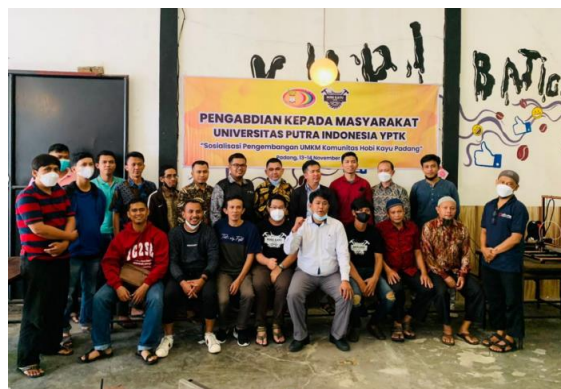
Gambar 5. Foto Suasana Peserta Mengikuti Kegiatan