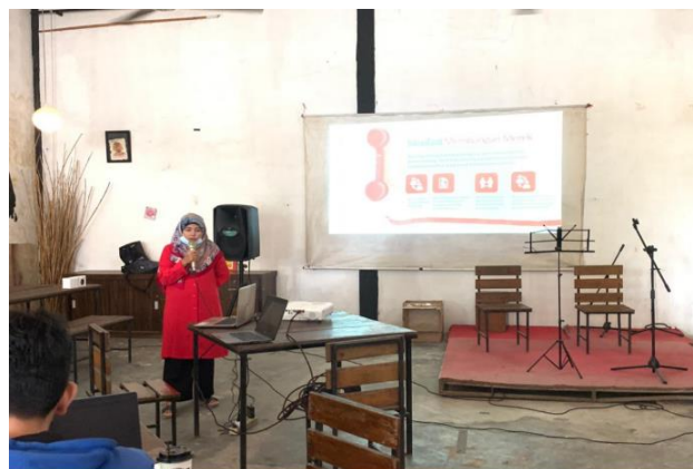
Gambar 2. Foto Penyampaian Materi

Pengabdian kepada masyarakat ini dilaksanakan selama 2 hari yaitu tanggal 20-21 November 2021. Berdasarkan hasil kajian dan identifikasi yang telah dilakukan ternyata banyak persoalan / hambatan yang dihadapi oleh pengrajin kayu di Padang dalam mengembangkan usahanya. Berdasarkan hasil survei dan wawancara dengan ada beberapa masalah yang perlu segera dicarikan solusinya. Masalah yang menjadi prioritas adalah bagaimana memasarkan produk yang sudah dibuat oleh pengrajin, pengembangan desain produk dan peningkatan minat konsumen.