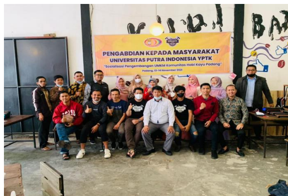
Gambar 3. Foto Suasana Peserta Mengikuti Kegiatan