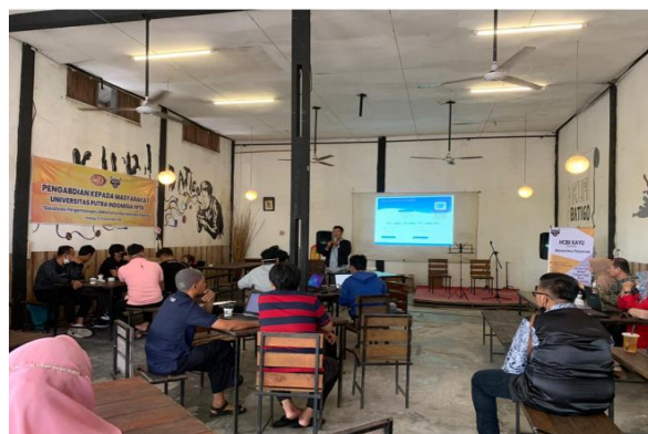
Gambar 4. Foto Suasana Peserta Mengikuti Kegiatan