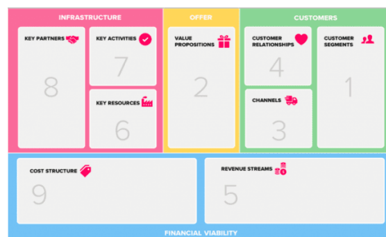
Gambar 1. Bisnis Model Canvas

Canvas ini membagi business model menjadi 9 buah komponen utama, kemudian dipisahkan lagi menjadi komponen kanan (sisi kreatif) dan kiri (sisi logik). Persis seperti otak manusia. Ke sembilan komponen yang ada tersebut adalah sebagai berikut, (diurut dari kanan ke kiri).Customer Segment, Customer Relationship, Customer Channel, Revenue Structure, Value Proposition, Key Activities, Key Resource, Cost Structure, dan Key Partners[6]