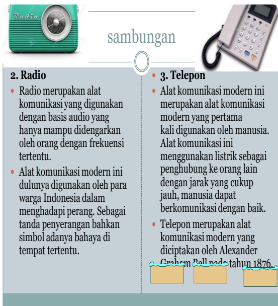
Gambar 4 sambungan alat komunikasi