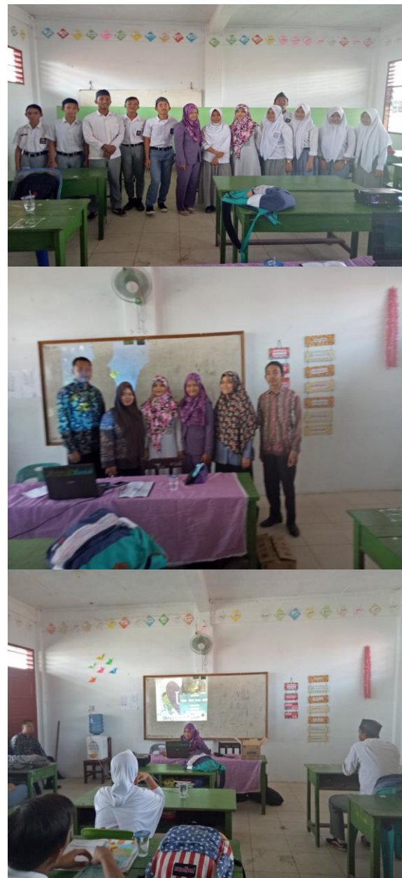
Gambar 7 Foto bersama dengan peserta abdimas dan para guru dan kepala sekolah

adalah keterbatasan waktu lokakarya serta masih kurangnya peserta dalam abdimas ini. Dapat di lihat pada gambar 6