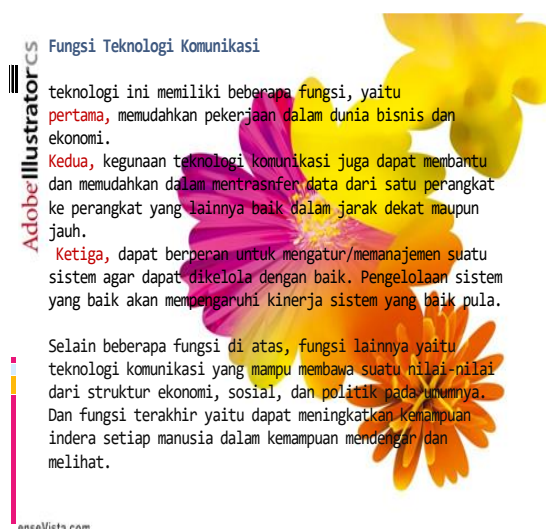
Gambar 2 fungsi teknologi komunikasi