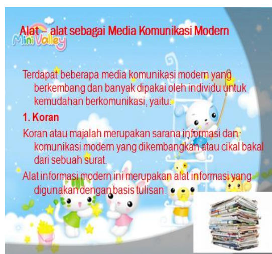
Gambar 3. Alat komunikasi