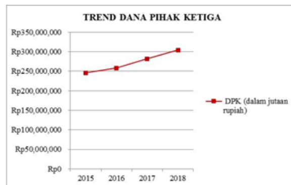
Gambar 1. Rata-rata DPK 12 sampel yang dipakai periode 2015 - 2018

Ini rata-rata data empiris yang menunjukkan pergerakan variabel DPK, GWM dan ROA.