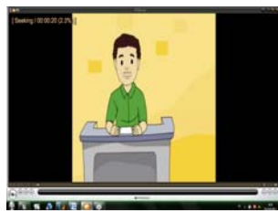
Gambar 4.1 Tampilan Cuplikan Adegan Scene 1

Seorang narasumber memberikan penjelasan tentang alur nikah, rujuk dan wakaf