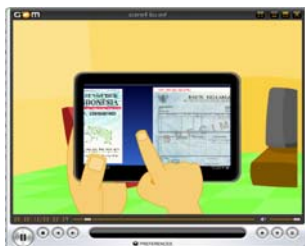
Gambar 4.2 Tampilan Cuplikan Adegan Scene 1

Seorang narasumber memberikan penjelasan tentang alur nikah, rujuk dan wakaf