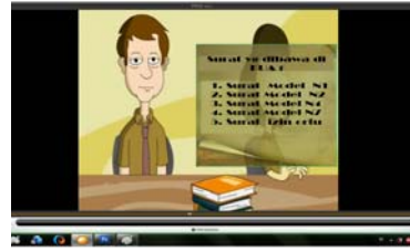
Gambar 4.3 Tampilan Cuplikan Adegan Scene 4

Seorang ibu memberitahukan surat-surat yang harus di bawa untuk proses pendaftaran nikah ke KUA melalui Ipad