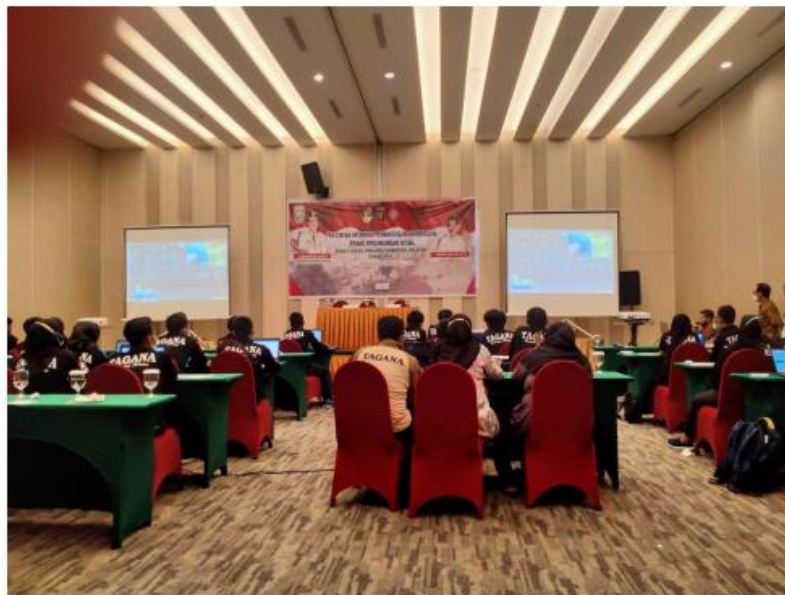
Gambar 1. Peserta Pelatihan Sedang Mendengarkan Pemaparan

Dari data kehadiran peserta terdapat 34 jumlah peserta yang mengikuti pelatihan. Perhitungan jumlah peserta sebanyak 24 orang atau 70,6% peserta berjenis kelamin laki-laki dan 10 orang atau 29,4 % peserta berjenis kelamin perempuan. Semua peserta pelatihan berasal dari bagian Sumber Daya Manusia di Dinas Provinsi Sumatera Selatan.