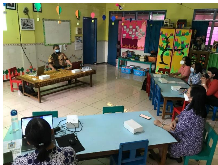
Gambar 1. Aktifitas Bagian Pertama

Bagian pertama yaitu seeking information atau pencarian informasi menjelaskan mengenai cara pencarian materi yang efektif melalui search engine . Dengan cara yang sederhana serta singkat maka dapat dihasilkan gambar serta video yang benar-benar dibutuhkan oleh para guru dalam melaksanakan pembelajaran secara daring. Begitu pula dengan aplikasi serta situs yang memang dapat dimanfaatkan secara lebih optimal agar siswa TK tidak merasa “berbeda” dibandingkan pembelajaran konvensional. Selain itu, disarankan agar siswa juga secara aktif dilibatkan oleh guru dalam proses pencarian bahan pembelajaran, dikarenakan disrupsi teknologi di masa pandemi sangat pesat bagi generasi saat ini (Chauca et al., 2021).