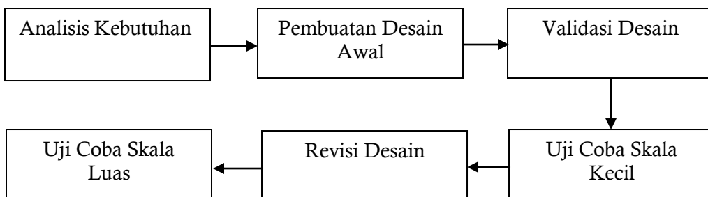
Gambar 1. Alur Penelitian

Jenis penelitian yang akan digunakan adalah penelitian Research and Development (R&D). Penelitian ini bertujuan untuk mengembangkan suatu produk baru atau menyempurnakan produk yang telah ada dalam hal ini adalah untuk mengembangkan sistem kejuaraan senam artistic berbasis virtual. Tahapan penelitian ini menggunakan langkah-langkah pengembangan R&D sebagai berikut: