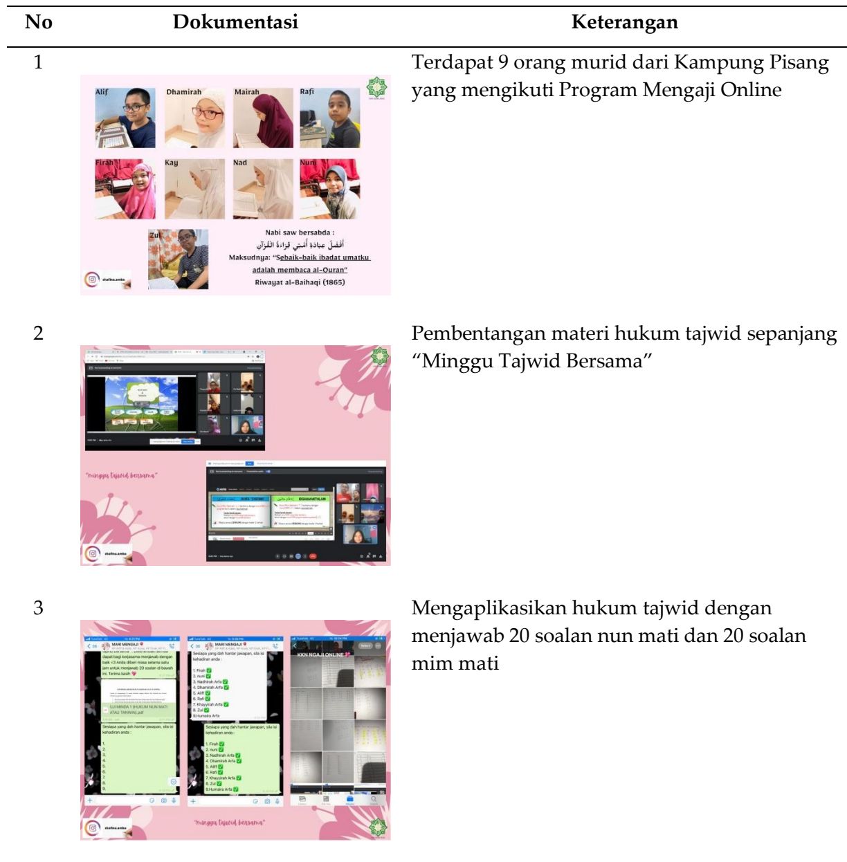
Tabel 1. Kegiatan mengaji online

dari rumah masing-masing serta dapat meningkatkan penguasaan dalam ilmu tajwid yang kini ramai orang mampu untuk membaca al-Quran dengan baik namun tidak mampu untuk mengetahui hukum tajwid secara dalam lagi. Tabel 1 menyajikan kegiatan pengabdian mengaji online.