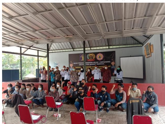
Gambar 2 Sesi Foto Bersama pada Pelatihan Kewirausahaan Warga Binaan Lapas Kelas 2 Kota Tangerang

Dalam sesi pelatihan mengenai peluang usaha, warga binaan diberikan beberapa opsi