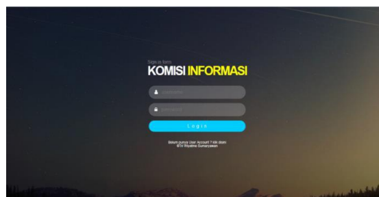
Gambar 3. Halaman Login

Halaman yang pertama kali ditampilkan untuk menyaring pengguna yang ingin memakai sistem informasi.