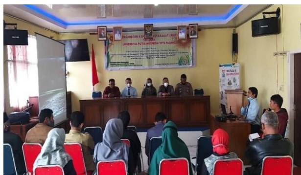
Gambar 2. Sosialisasi di lokasi Kegiatan PKM

Pada tahap pelaksanaan ini pertama kali kami melakukan sosialisasi dan pembuatan spanduk promosi portal pemerintahan nagari. Sosialisasi kami lakukan dengan mengunjungi kantor wali nagari tersebut dan menyampaikan surat permohonan izin untuk melaksanakan kegiatan PKM selanjutnya kami mendisain spanduk untuk pelaksanaan kegiatan PKM. Berikut di bawah ini foto kegiatan Sosialisasi dan Spanduk kegiatan PKM, seperti terlihat pada Gambar 2.