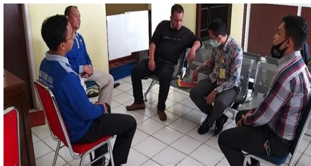
Gambar 1. Koordinasi dengan Mitra PKM

memperlihatkan kegiatan Koordinasi dengan Mitra PKM, seperti terlihat pada Gambar 1.