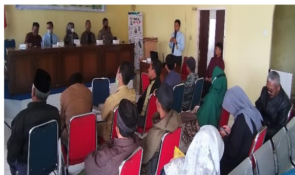
Gambar 5. Kegiatan Pelatihan Penggunaan Website Nagari

Selanjutnya setelah website/portal pemerintahan nagari tersebut selesai kami buat dan kami hosting di internet maka kami melakukan pelatihan dan pendampingan dalam literasi digital dan penggunaan website / portal tersebut. Pelatihan kami lakukan selama 2 hari yaitu Senin dan Selasa tanggal 01-02 November 2021 dari Pukul 09:00-6:00 WIB dengan istirahat selama satu jam yaitu pukul 12:00-13:30 WIB sedangkan untuk pendampingan pertama kali kami lakukan langsung setelah pelatihan sedangkan pendampingan secara berkelanjutan kami lakukan selama 1 tahun secara online. Berikut dibawah ini foto kegiatan pelatihan dan pendampingan seperti terlihat pada Gambar 5.