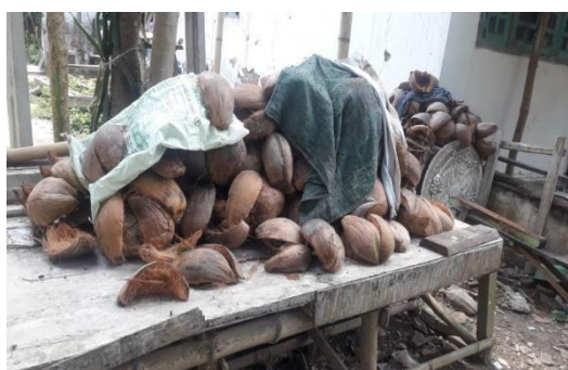
Gambar 2. Tumpukan sabut kelapa yang dibiarkan begitu saja sampai kering dan oleh warga hanya dimanfaatkan sebagai kayu bakar

Untuk pemanfaatannya, awalnya warga hanya memanfaatkan buah kelapa atau daging kelapa untuk diproses sendiri sebagai bahan kebutuhan sehari-hari, untuk dijual ke toko-toko sekitar atau dijual ke pasar, sementara untuk sabut kelapanya sendiri tidak dimanfaatkan oleh warga. Hal ini banyak dijumpai di sekitar rumah warga sabut kelapa hanya ditumpuk dan dibiarkan begitu saja, ada juga sebagian warga menjemur sabut kelapa tersebut sampai kering dan apabila sudah kering warga menggunakannya sebagai kayu bakar, sehingga dapat dikatakan warga tidak memanfaatkan sumber daya alam dengan semaksimal mungkin.