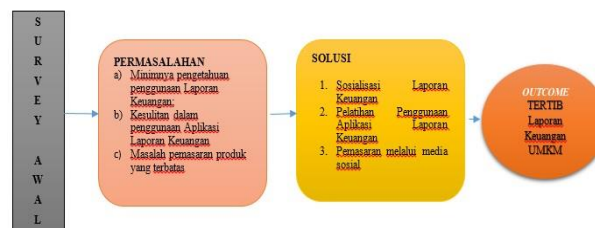
Gambar 2. Skema Solusi Permasalahan

Deskripsi lengkap bagian metode pelaksanaan untuk mengatasi permasalahan dalam gambar sesuai tahapan sebagai berikut :