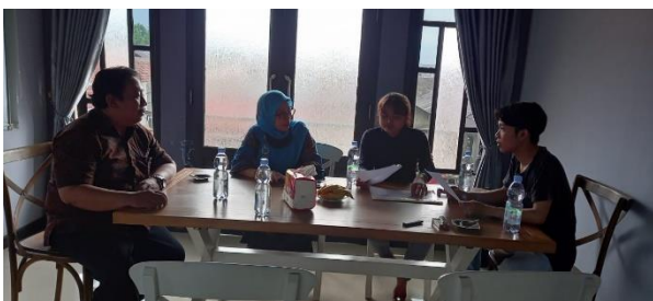
Gambar 7. Evaluasi Program Kemitraan Masyarakat