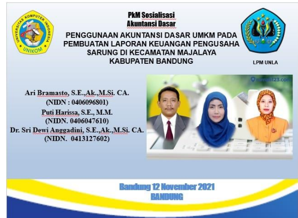
Gambar 4. Backdrop Kegiatan Program Kemitraan Masyarakat