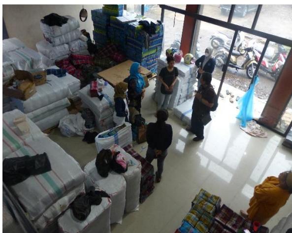
Gambar 1. Pabrik Sarung CV Mekar Jaya

CV. Mekar Jaya yang terletak di Jl. Raya Laswi Ciwalengke No. 133 Kecamatan Majalaya Kabupaten Bandung, Jawa Barat 40382, termasuk pengusaha UKM di daerah Kabupaten Bandung dan pabrik textile skala mikro kecil di ibu kota provinsi Jawa Barat ini. Hasil produksinya sarung, bahan baku sarung dan kain (contoh benang), bahan baku lainnya, tempat penyimpanan bahan baku pembuatan sarung dan gudang sarung.