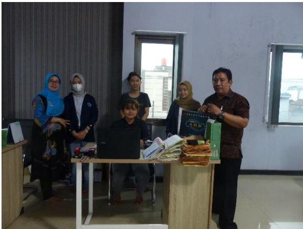
Gambar 6. Persiapan Tim PkM dan Sebagian Peserta Pelatihan