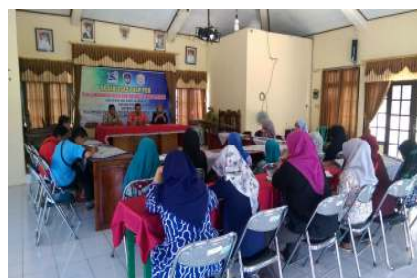
Gambar 1. Sosialisasi dan FGD

Kegiatan dalam pengembangan potensi kopi sebagai perwujudan desa sentra kopi rempah Kecamatan Patean Kabupaten Kendall ini telah dipublikasi dalam media massa. Kegiatan sosialisasi dan FGD sudah dipublikasi oleh media massa di harian Wawasan Jumat, 27 Juli 2018 dan website Universitas PGRI Semarang yang telah dipublikasi juga pada Kamis, 26 Juli 2018. Serta kegiatan pelatihan sudah dipublikasi oleh media massa di harian Suara Merdeka Sabtu, 1 September 2018.