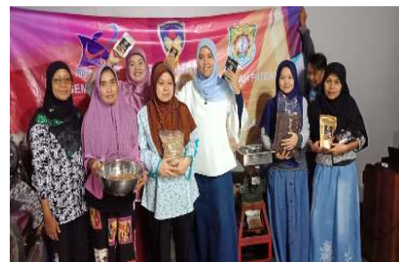
Gambar 2. Pelatihan dengan Mitra