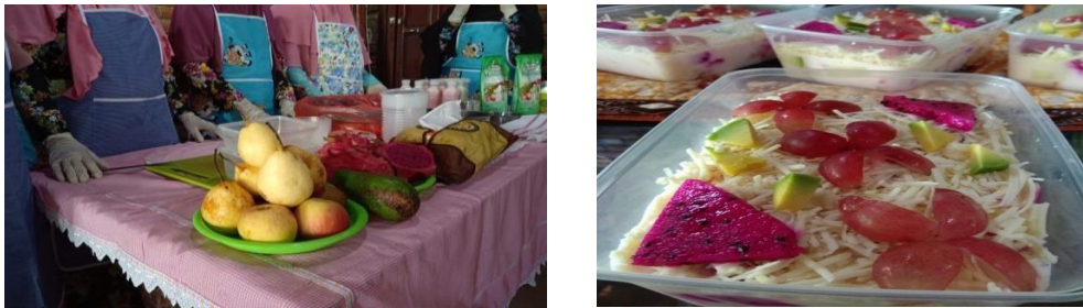
Gambar 1. Produk

Kendala-kendala tersebut menyebabkan ODGJ tidak bisa mempertahankan pekerjaannya dalam waktu lama, sehingga kembali tidak bekerja. Kondisi-kondisi tersebut menyebabkan hilangnya produktivitas ODGJ. Hal ini membutuhkan adanya upaya untuk membantu ODGJ mengembalikan kemandirian dan produktivitasnya.