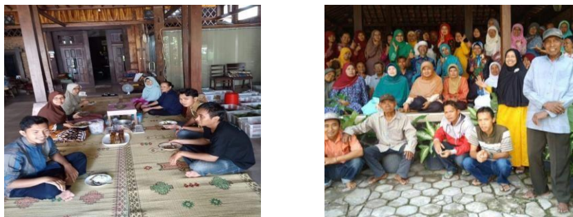
Gambar 4. Suasana Pelatihan

kesehatan. Usaha OBAH memiliki 2 instruktur yang mendampingi ODGJ/peserta pelatihan dalam menjalankan terapi kerja. Peserta pelatihan setiap hari semakin terampil dalam pekerjaannya dan semakin luas pemasarannya atas pendampingan tim pengabdian masyarakat UMY. Dengan demikian peserta pelatihan/ODGJ mendapatkan penghasilan dari hasil penjualan produk usaha OBAH. Sehingga kegiatan ini telah mengembalikan produktivitas ODGJ.