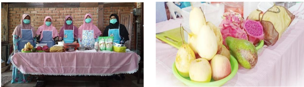
Gambar 3. Fasilitator dan produk

Usaha OBAH didirikan untuk memberikan terapi kerja kepada ODGJ agar dapat bekerja, sehingga kembali produktif. Jenis usaha OBAH yang dilakukan adalah menjual buah segar, membuat salad buah, dan sup buah. Usaha-usaha tersebut membutuhkan keterampilan yang cukup sederhana sehingga ODGJ mampu untuk dilatih dan melakukan pekerjaan sesuai dengan kemampuan. ODGJ diberikan pelatihan cara pengemasan buah segar, pembuatan salad buah dan sup buah dengan memperhatikan standar kebersihan dan