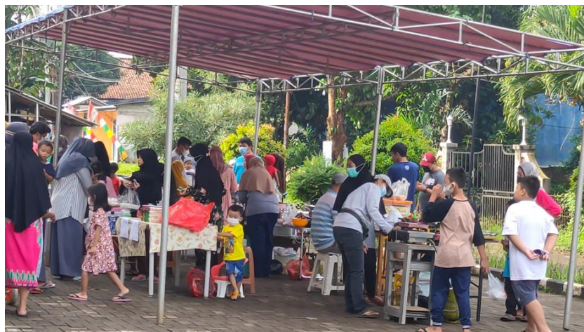
Gambar 2. Bentuk implementasi setelah penyuluhan