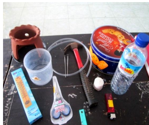
Gambar 3. Alat-alat yang digunakan untuk membuat memperkenalkan teknik destilasi sederhana

Kegiatan dilanjutkan dengan kegiatan ceramah dan diskusi. Ceramah yang dibawakan dengan judul: Alat Destilasi Sederhana sebagai Media Edukasi untuk Meningkatkan Minat Wirausaha Siswa dalam Bidang Pertanian dan Perkebunan . Tahap selanjutnya adalah praktek perancangan sendiri alat-alat destilasi sederhana. Alat-alat yang digunakan diperlihatkan pada Gambar 3.