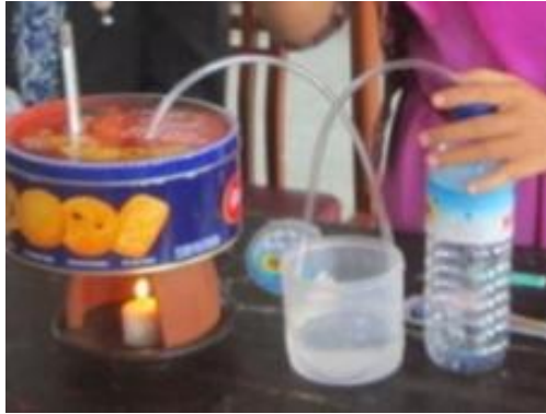
Gambar 4. Model Alat Destilasi Sederhana

Setelah tahap sosialisasi dan praktik berakhir dilakukan post test tentang pemahaman konsep destilasi dan kewirausahaan. Hasil post test menunjukkan 90% parasiswa-siswi SMA IT Al Kamal NW Narmada paham tentang konsep destilasi sederhana dan 75% paham tentang bagaimana penerapan konsep kewirausahaan dalam bidang perkebunan dan pertanian.