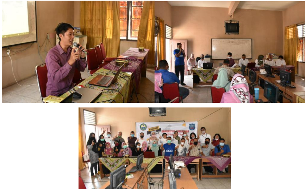
Gambar 2. Proses Pelaksanaan Pelatihan Aplikasi Google Classroom