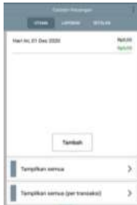
Gambar 2. Menu utama

Berikut adalah interface Catatan Keuangan Harian tersebut.