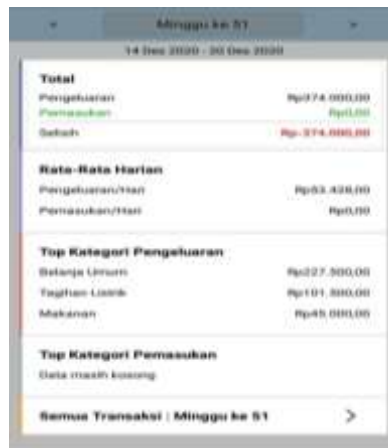
Gambar 9. Laporan per Minggu