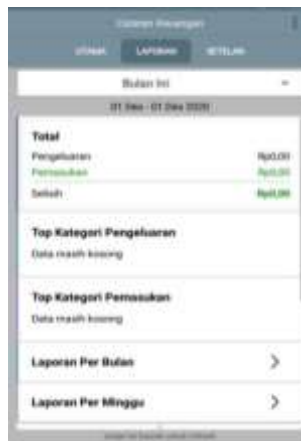
Gambar 3. Menu Laporan