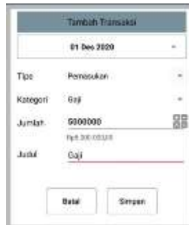
Gambar 7. Tambah Transaksi