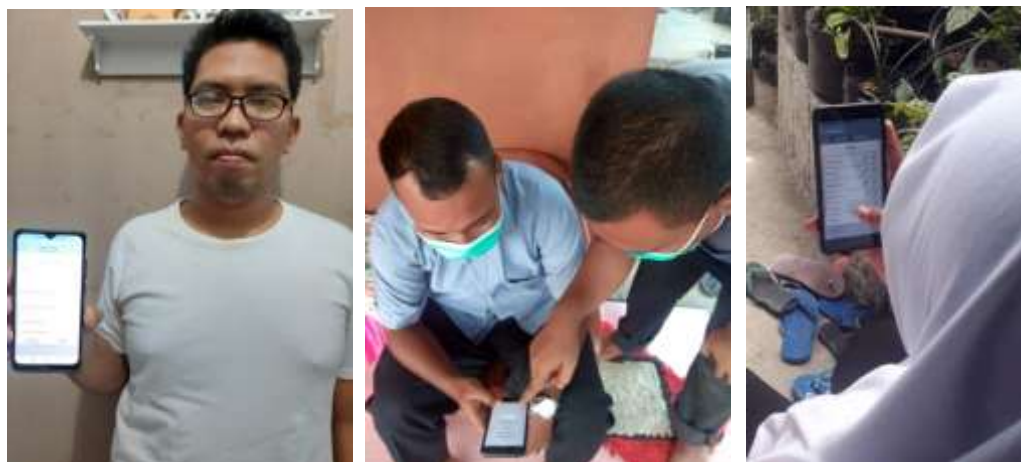
Gambar 11. Dokumentasi Pengabdian Kepada Masyarakat

Untuk tahap yang terakhir adalah Export/ Simpan laporan. Pada tahap ini Kita dapat menyimpan seluruh laporan menjadi satu file dalam format pdf. Ketika proses selesai, maka laporan dalam format pdf tersebut dapat kita printout.