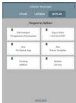
Gambar 4. Menu Setelan