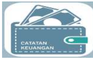
Gambar 1. Catatan Keuangan

Berikut adalah interface Catatan Keuangan Harian tersebut.