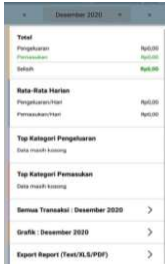
Gambar 5. Semua Transaksi