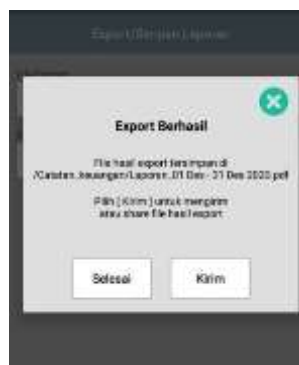
Gambar 10. Simpan Laporan

Kita juga dapat melihat laporan perminggu yang bisa kita lihat detail dalam kurun waktu beberapa tahun. Gambar disamping menunjukkan minggu ke 51 dimana 1 tahun ada 48 minggu, yang berarti gambar disamping menunjukkan minggu yang masuk tahun ke-2nya