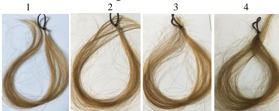
Gambar 1. Pengaruh Waktu Perendaman Hasil Pewarnaan Rambut Uban

Berdasarkan hasil pengamatan terhadap percobaan yang telah dilakukan diketahui bahwa lamanya waktu perendaman mempengaruhi hasil pewarnaan rambut uban seperti terlihat pada Gambar 1 dibawah ini yang diambil dari Formula B.