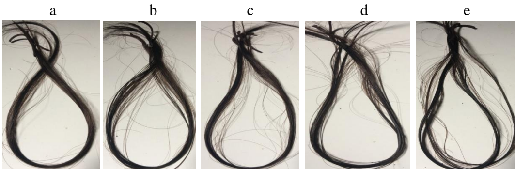
Gambar 2. Stabilitas Warna Terhadap Pencucian

Berdasarkan uji stabilitas warna terhadap pencucian diperoleh hasil bahwa tidak terjadi perubahan warna rambut setelah 15 kali pencucian seperti pada Gambar 2 berikut: