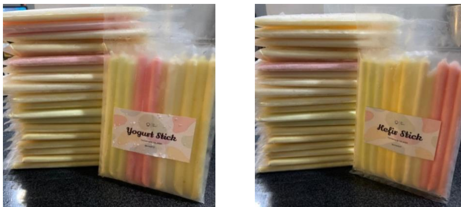
Gambar 3. Produk es stik mambo yoghurt dan kefir produksi ONSPOT

Kondisi pandemi yang menyebabkan ONSPOT kehilangan pasar potensialnya tidak membuat ONSPOT patah semangat. Agar usaha bisa tetap jalan, ONSPOT merubah strategi pemasaran dengan merubah target pasar potensial yaitu dari mahasiswa ke ibuk ibuk rumah tangga. Konsepnya adalah yoghurt dan kefir diolah menjadi es stik mambo, yang akan menjadi alternatif jajanan sehat keluarga. Es stik mambo di kemas dalam pack yang berisi 10 pieces . Promosi dilakukan melalui media sosial (aplikasi WA dan facebook).