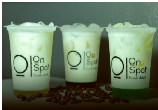
Gambar 1. Produk minuman kekinian ONSPOT; yoghurt ice blended

Konsep kekinian yang diangkat mahasiswa tersebut adalah yoghurt dan kefir disajikan dalam bentuk minuman ice blended yaitu yoghurt/kefir disajikan dalam bentuk minuman segar dengan berbagai varian rasa yang dikemas dalam cup praktis dan dilengkapi dengan topping boba. Penyajian yoghurt dan kefir dengan konsep kekinian disesuaikan dengan target utama pasar yaitu kalangan muda yang berpendidikan yaitu pelajar dan mahasiswa.