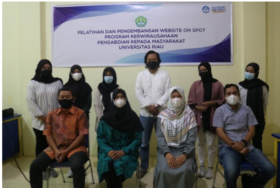
Gambar 4 . Pelaksanaan Pelatihan dan Pengembangan Website ON SPOT

ONSPOT melakukan promosi melalui website agar usaha dapat bersaing dalam search engine . Website tersebut mampu menampilkan informasi-informasi mengenai produk yang ditawarkan. Adanya website ONSPOT dapat mempermudah konsumen dalam melakukan pemesanan, transaksi bisnis, dan dapat dijadikan sebagai sarana promosi dan pemasaran. Berikut tampilan website ONSPOT. Link website ONSPOT: https://onspot.co.id/2021/07/17/program-kewirausahaan-pengabdian-kepada-masyarakat-berkerjasama-dengan-lembaga-pabrik-cerdas-dalam-pengembangan-website-on-spot/