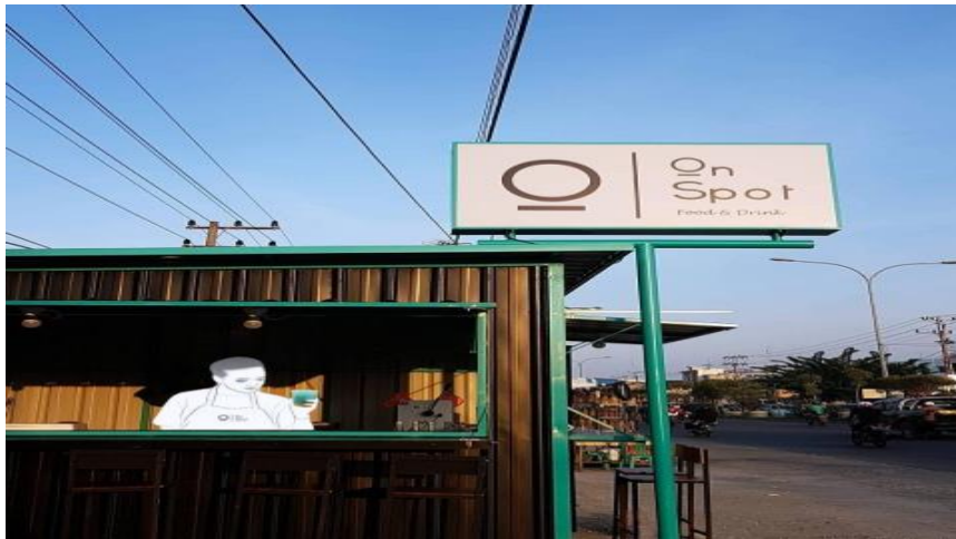
Gambar 2. Street Vendor ONSPOT di jalan HR.Soebrantas

Belum lama berdiri atau sekitar 6 bulan usaha berjalan, usaha mengalami guncangan berupa terjadinya penurunan omset secara drastis disebabkan karena diberlakukannya Pembatasan Sosial Berskala Besar (PSBB) dan kuliah dilakukan secara daring. Kondisi ini menyebabkan ONSPOT kehilangan pasar potensialnya karena sebagian besar mahasiswa pulang kampung. Berlanjutnya kondisi PSBB membuat street vendor ONSPOT harus ditutup.