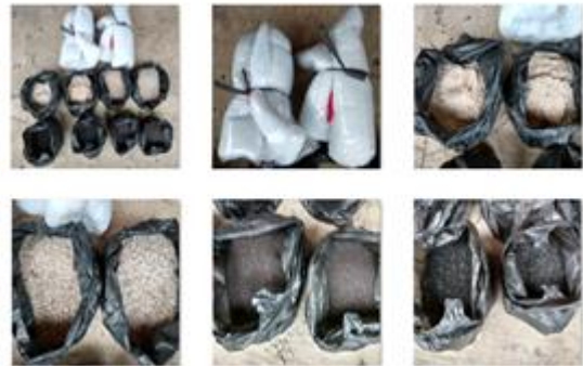
Gambar 4. Bahan-bahan yang dipergunakan untuk media filter perangkat penjernihan air sumur sederhana.

https://www.youtube.com/watch?v=TbGp8e3NLa4 [3].