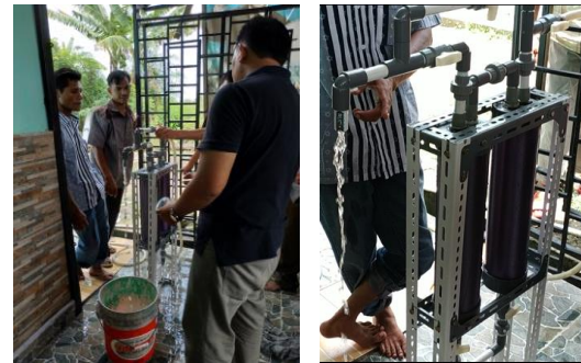
Gambar 7. Aktivitas bapak-bapak peserta program PPM melihat hasil penjernihan dan mempraktekan cara-cara perawatan peralatan dengan sistem backwash (pencucian balik).

Hasil uji coba untuk menjernihkan air sumur gali terlihat pada Gambar 7, air yang disaring terlihat lebih jernih, tidak berbau dan tidak berkarat