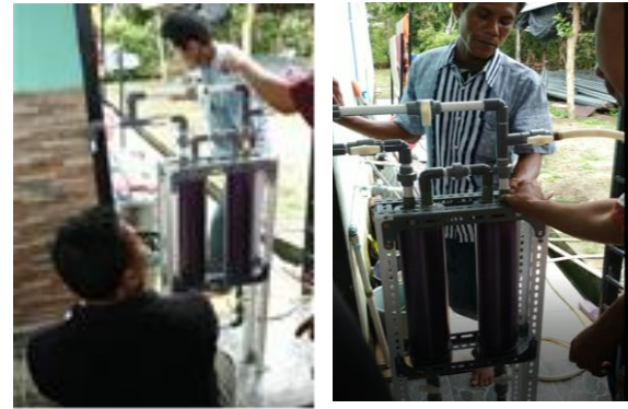
Gambar 6. Aktivitas bapak-bapak peserta program PPM mencoba alat penjernih air

Bapak-bapak yang merakit peralatan terlihat sangat antusias dan berniat untuk mencoba membuat perangkat tersebut di rumah masing-masing, aktivitas mereka dapat dilihat pada Gambar 6 berikut ini. Setelah perangkat selesai di rakit, selanjutnya diuji cobakan untuk menyaring air dari sumber air sumur gali yang masih berkarat, hasil penyaringan menunjukkan air hasil saringan memiliki kualitas yang lebih baik.