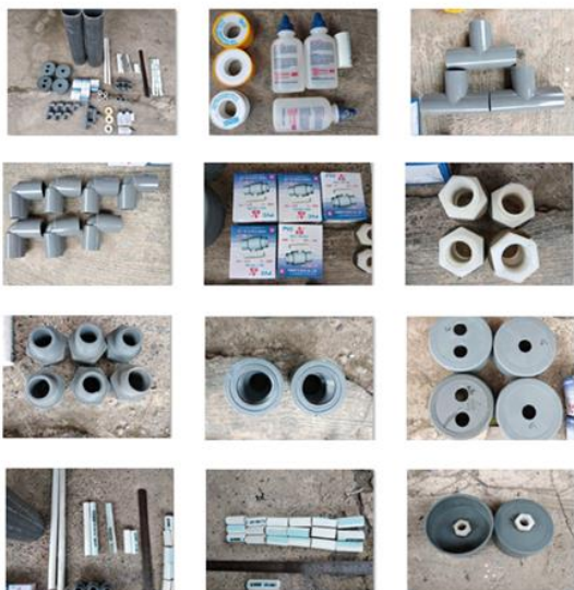
Gambar 3. Peralatan yang dipergunakan untuk merangkai dan memasang perangkat penjernihan air sumur sederhana.

serta bahan yang digunakan untuk menjernihkan air, yang terdiri atas