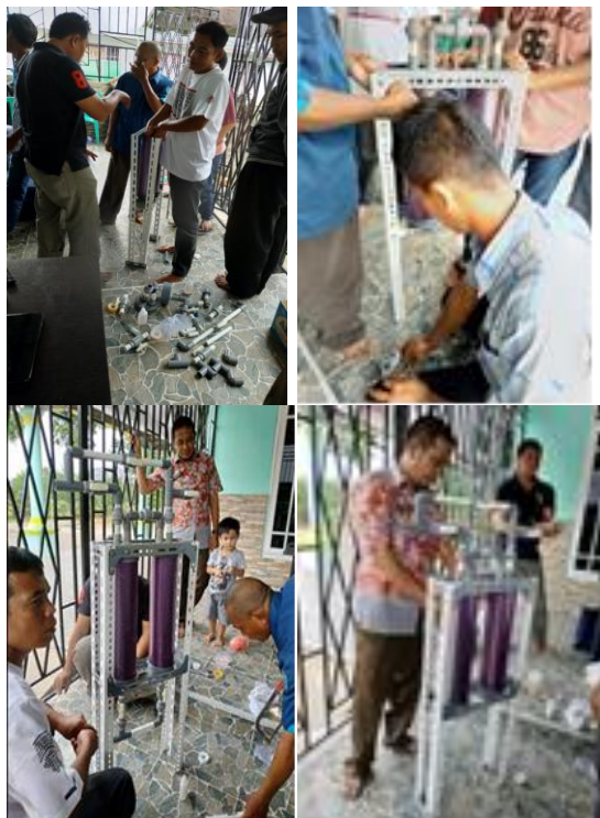
Gambar 5. Aktivitas bapak-bapak peserta program PPM merakit alat penjernih air

pelatihan dan mengerjakan perakitan peralatan penjernihan air sederhana. Masyarakat sangat mendukung dan berpartisipasi secara aktif pada waktu kegiatan dilaksanakan, mulai dari kegiatan awal persiapan dan pra pelatihan hingga pada waktu evaluasi kegiatan. Masyarakat mulai menyadari dan mendapat wawasan baru bahwa hanya dengan bahan dan peralatan sederhana dan murah alat penjernihan air ini dapat dibuat, terlihat dari gambar 5 dibawah ini