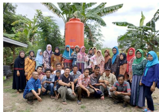
Gambar 8. Perangkat penjernihan air sumur sederhana telah terpasang pada tedmon penampung air sumur yang disumbangkan kepada penduduk Desa Tanjung Pering melalui PPM program pengembangan Desa binaan Unsri ini.