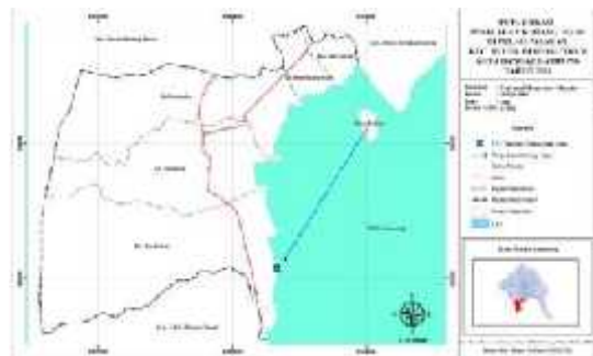
4.8 Peta Pemasaran Kerang Hijau

lempasing. Dari data yang ada dapat dilihat bahwa pemasaran yang dilakukan oleh nelayan kerang hijau di pulau pasaran adalah dengan cara menjual ke pelelangan ikan dengan jumlah 75 orang atau 97,40 %. Pemasaran kerang hijau merupakan pemasaran dengan jumlah besar, besarnya penjualan kerang hijau ke TPI (Tempat Pelelangan Ikan) dikarenakan banyaknya permintaan dari tempat pelelangan ikan, selain itu harga di tempet pelelangan ikan yang relatif stabil mengakibatkan banyak kepala keluarga nelayan kerang hijau di Pulau Pasaran menjual ke tempat pelelangan ikan. Walaupun tempat penjualan yang relatif jauh jika dilihat dari Pulau Pasaran.