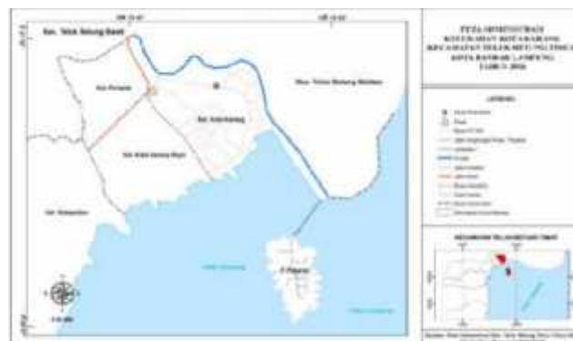
Gambar 4.2 Peta Kelurahan Kota Karang Kecamatan Teluk Betung Timur Kota Bandar Lampung Tahun 2016.