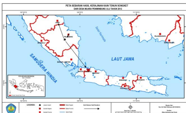
Gambar 2. Peta Persebaran Hasil Kerajinan Kain Tenun Desa Muara Penimbung Ulu Tahun 2012

Berdasarkan hasil wawancara dengan Ibu Masayu (tokoh masyarakat) bahwa beberapa pengumpul berasal dari Palembang (Sumatera Selatan), Jakarta (DKI Jakarta), dan Jambi (Jambi) yang kemudian kerajinan kain tenun songket tersebut dipasarkan ke wilayah kota/kabupaten masing-masing wilayah, menurutnya pemasaran hasil kerajinan kain tenun songket lebih banyak dibawa ke daerah yang lebih padat penduduk seperti kota Palembang, Jakarta, Jambi, dan Bali. Selain itu, hasil kerajinan tersebut mereka pasarkan di pusat perbelanjaan daerah Ogan Ilir yang biasa mereka sebut dengan pasar induk. Untuk lebih jelas dapat dilihat pada peta berikut ini.