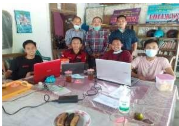
Gambar 7. Pelatihan Pengelolaan Website UKM