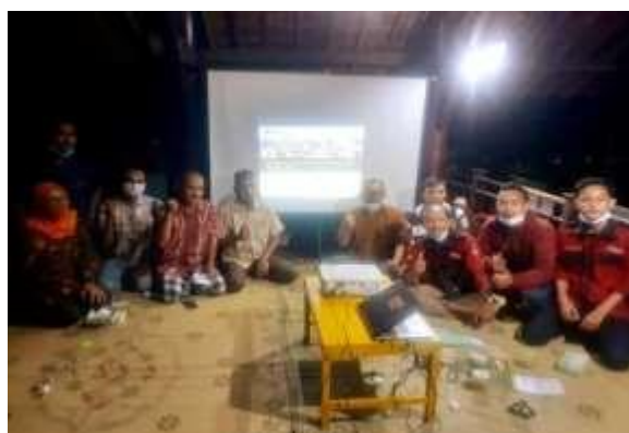
Gambar 2. Rapat Koordinasi dengan Mahasiswa KKN dan Pedukuhan Serut

Kegiatan sosialisasi dilakukan dengan menjaga protokol kesehatan serta meminta persetujuan dari pedukuhan. Langkah awal sebelum dilakukannya sosialisasi dilaksanakan silaturahmi dengan aparat pedukuhan. Selanjutnya berdasarkan kesepakatan bersama serta mengurangi banyaknya aktivitas kumpul warga maka kegiatan sosialisasi pada tokoh masyarakat, pelaku UMKM, dan perwakilan aparat kalurahan dilakukan secara bersamaan dengan pelatihan pengelolaan website.