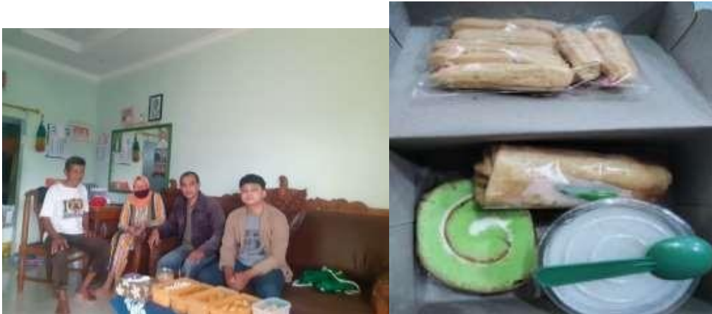
Gambar 3. Wawancara dengan Produsen Wawa Catering dan Produk

Dalam proses pemetaan ini, tim bersilaturahmi dengan pelaku UMKM untuk membuat jadwal dan kapan saat yang tepat untuk wawancara tanpa mengganggu aktivitasnya . Untuk itu UMKM yang bersedia diwawancarai sebagai berikut: