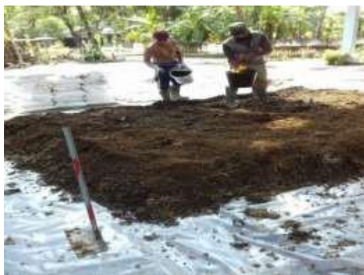
Pembuatan Pupuk Kompos Untuk Pisang Cavandis