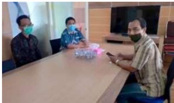
Gambar 5. Koordinasi dengan Disinfokom Bantul

Fasilitasi pembuatan website bagi UKM pada mulanya direncanakan akan bekerjasama dengan Desa Cyber. Untuk itu diperlukan koordinasi dengan Kepala Kalurahan dan Disinfokom Bantul. Dari hasil koordinasi dengan pihak kalurahan, kalurahan pada dasarnya bersedia bekerjasama untuk memanfaatkan program tersebut apabila masih ada dan bisa dipergunakan untuk publik . Setelah adanya goodwill dari pihak kalurahan, tim menemui pihak Disinfokom, pihak Disinfokom tidak dapat memutuskan karenaposisinya sebagai pengelola. Disinfokom akan memfasilitasi bilamana terdapat rekomendasi dari Depkop Bantul. Mengingat panjangnya jalur birokrasi yang ditempuh, maka tim memutuskan untuk memfasilitasi UMKM Serut secara mandiri yakni menyewakan website bagi UMKM dan karang taruna sebagai media berlatih warga.