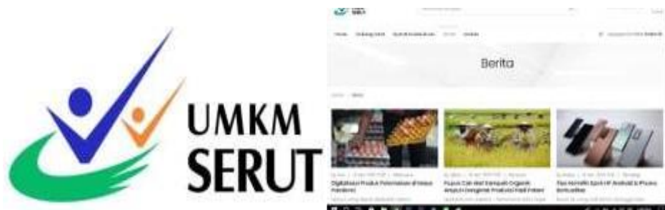
Gambar 6. Konten Website UMKM Serut Palbapang Bantul

namun menyediakan pertokoan yang di dalamnya berisikan aneka produk warga. Sedangkan admin website bekerja sama dengan karang taruna yang didukung oleh dasawisma. Untuk itu pembagian peran antara dasawisma agar mendorong pelaku UMKM agar mau memasukkan produknya ke website.