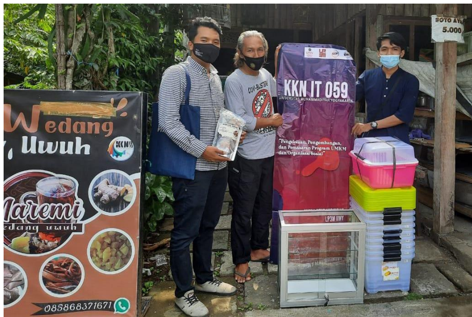
Gambar 6. Penyerahan Hibah Peralatan Kepada Mitra Wedang Uwuh Maremi

Peningkatan operasional usaha dilakukan dengan cara memberikan hibah peralatan penunjang Wedang Uwuh Maremi. Hal ini didasarkan pada kekurangan peralatan penunjang Wedang Uwuh Maremi, sehingga terhambatnya kegiatan operasional. Adapun peralatan produksi tersebut yaitu etalase kaca, rak piring, kontainer, dan timbangan digital.