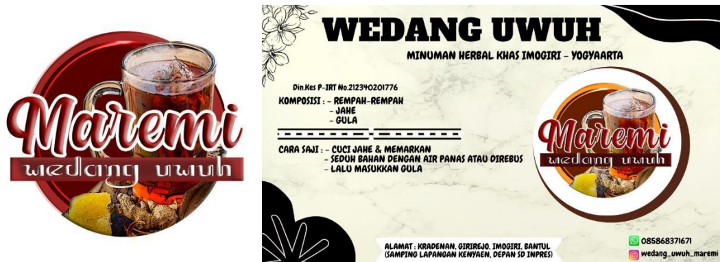
Gambar 1. Logo Produk Wedang Uwuh Maremi

Program pembuatan logo produk dilakukan agar produk dapat dikenali dan dapat dibedakan dengan usaha sejenis lainnya. Kemudian, logo produk ini dipasang pada kemasan yang terbaru sehingga konsumen dapat melihat dan mengetahui produk yang mereka beli merupakan produk yang dibuat oleh mitra agar identitas Wedang Uwuh Maremi dikenal oleh berbagai kalangan masyarakat.