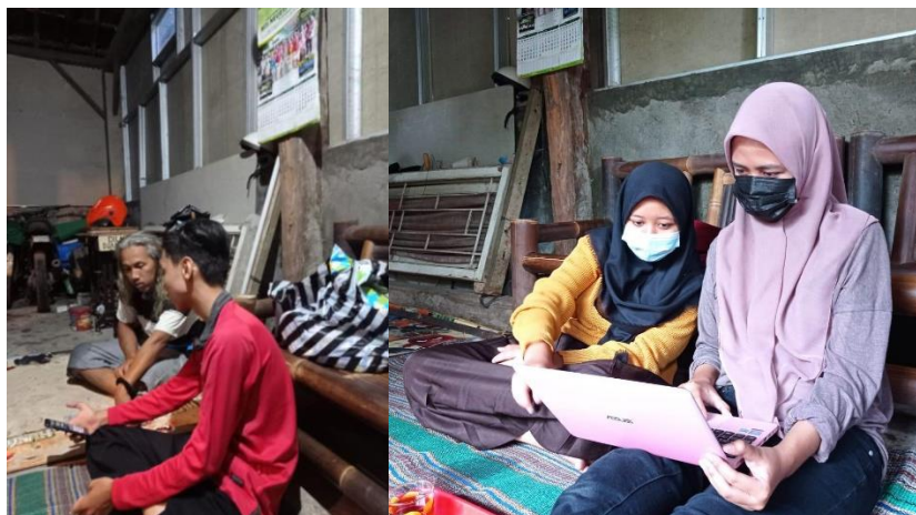
Gambar 4. Penyuluhan Aplikasi Instagram Kepada Mitra Wedang Uwuh Maremi

Program kerja penyuluhan aplikasi instagram ini bertujuan untuk membantu mitra usaha menggunakan aplikasi instagram sebagai media sosial yang digunakan pada usahanya. Selain itu diharapkan mitra dapat mengisi konten-konten secara rutin dan berkala dan memanfaatkannya dengan semaksimal mungkin. Adapun nama Instagram yang digunakan yaitu @wedang_uwuh_maremi. Pada program juga dilaksanakan dengan memberi penjelasan dan memberi design template feed instagram, foto produk dengan kemasan baru, membuat konten IGTV, dan memberi pengarahan penguploadan hasil testimoni dari konsumen.