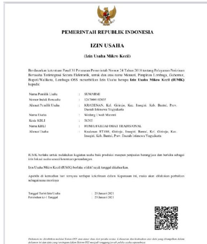
Gambar 3. Surat Perizinan IUMK Wedang Uwuh Maremi