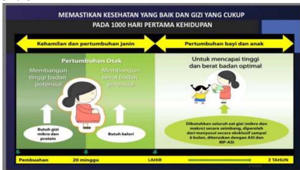
Gambar 3. Rentang waktu emas mencegah gizi buruk (Doddy Izwardy Kemkes, 2018)

menyiapkan makanan yang bernutrisi seimbang. Zat gizi dari makanan merupakan sumber utama untuk memenuhi kebutuhan anak tumbuh kembang optimal sehingga dapat mencapai kesehatan yang paripurna, yaitu sehat fisik, sehat mental, dan sehat sosial (Adante, 2018: 1). Kemudahan akses informasi dari berbagai sumber menjadi agenda pendukung. Misalnya informasi mengenai kapan nutrisi yang baik harus dipersiapkan. Rentang waktu 1000 hari pertama kehidupan harus gencar dilakukan sebagaimana sudah diprogramkan pemerintah (Gambar 3). Calon Ibu dan Ibu memegang peranan kunci karena sebagai pihak yang akan hamil, melahirkan dan mengawal asupan gizi bagi bayi dan balita. Sementara peran anggota keluarga yang lain dapat berbagi dengan memastikan ketersediaan bahan makanan dan proses penyajian makanan.