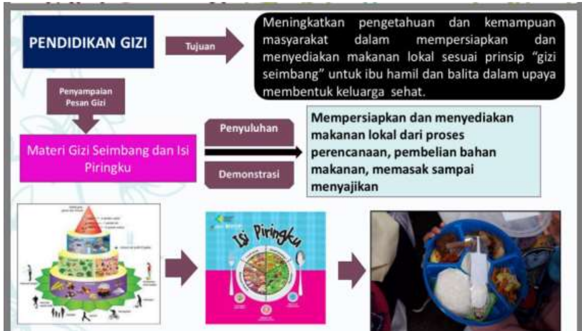
Gambar 4. Pola pendidikan gizi (Doddy Izwardy Kemkes, 2018)