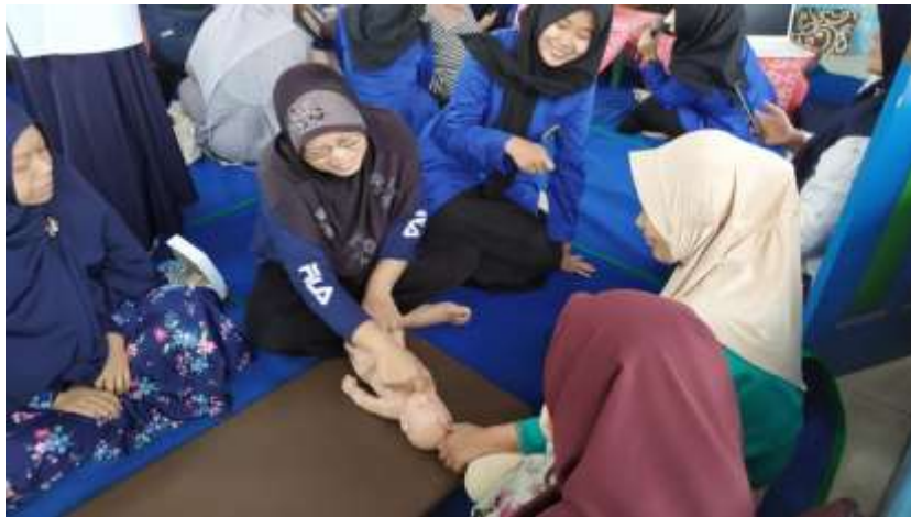
Latihan Pijat Bayi