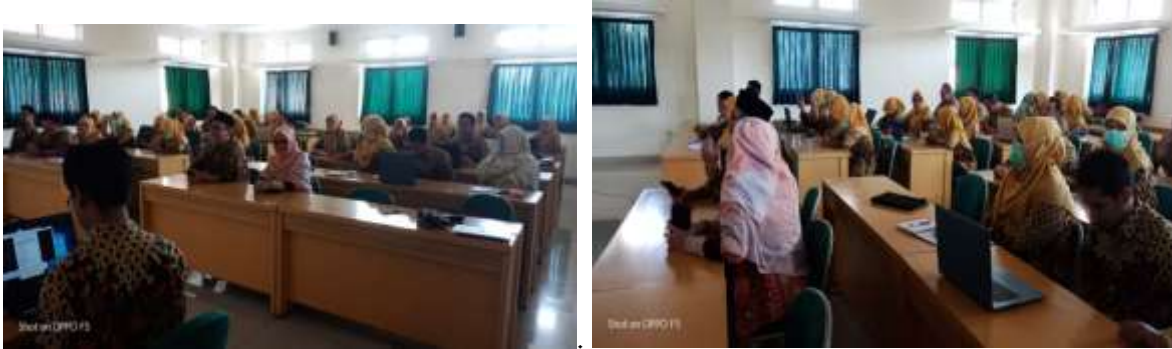
Gambar 2 Sosialisasi pengisian e-career path