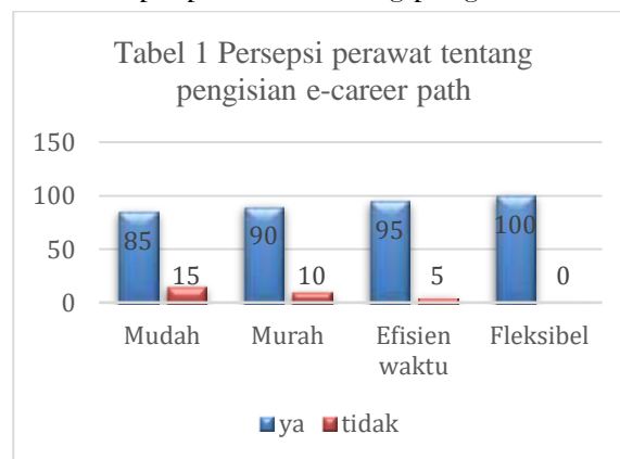
Gambar 3 Persepsi perawat tentang pengisian e-career path