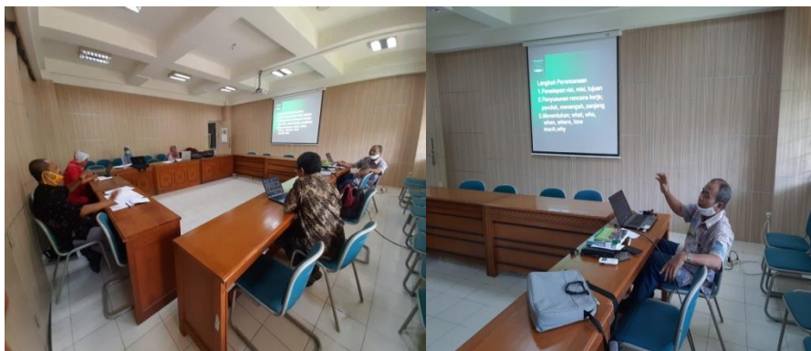
Gambar 3. Pelatihan Manajemen Perpustakaan di Perpustakaan UMY

Sistem informasi perpustakaan yang selama ini dilakukan secara manual (penulisan catalog, buku masuk dan peminjaman buku) maka secara bertahap akan dilakukan komputerisasi. Untuk itu sebagai arena berlatih pemustaka baru difasilitasi alamat website http://Jayari.masjidalmanar.com dengan tampilan sebagai berikut;