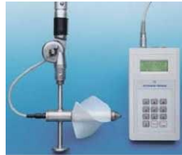
Gambar 1. Current meter

debit yaitu dengan membuat patok di kedua sisi tepi sungai. Kemudian mengikat tali di kedua sisi patok tersebut sehingga tali membentang dari tepi sungai yang satu ke tepi sungai yang lain, dengan demikian bisa diukur lebar sungai tersebut. Setelah didapat lebar sungai kemudian dibuat titik setiap jarak 25 cm dan disetiap titik dicari kecepatan alirannya dengan menggunakan alat current meter dan diukur kedalaman.