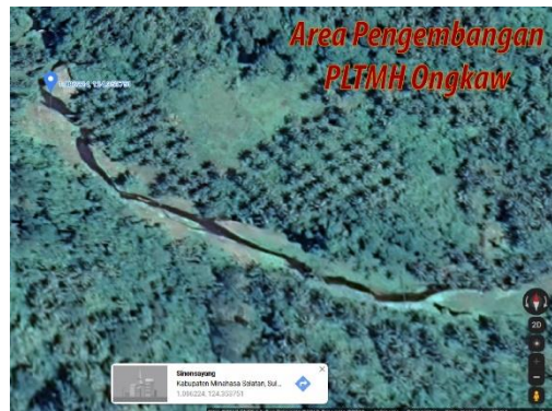
Gambar 5. Peta Lokasi Rencana Pengembangan PLTMH

Rencana penggunaan energi yang dihasilkan dari PLTMH Ongkaw direncanakan untuk menjadi sumber listrik alternatif di Desa Ongkaw. Serta untuk menerangi beberapa fasilitas umum.