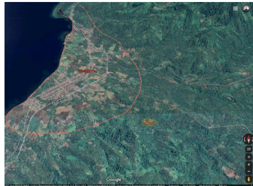
Gambar 4. Peta Lokasi Survey

Lokasi potensial rencana pengembangan PLTMH Ongkaw terletak di areal Sungai Ongkaw di wilayah Kecamatan Minahasa Selatan, Propinsi Sulawesi Utara. Sungai Ongkaw yang direncanakan akan digunakan airnya merupakan salah sumber air yang berada wilayah tersebut dan mengalir sepanjang tahun.