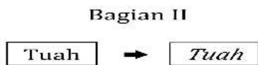
Gambar 2 Skema bagian buah

Bentuk garapan karya musik bagian ini menggunakan bentuk musik minimalis, dengan hanya menghadirkan dua pola motif melodi. Penggambaran suasana pada bagian ini, yaitu perwujudan kesan seimbang dan harmonis antara individu yang hidup dalam suatu masyarakat. Suasana harmonis di sini terwujudnya kesan sama antar individu yang hidup dalam suatu masyarakat, sehingga dalam proses menjalani kehidupan tersebut berjalan mengalir tanpa adanya suatu pertentangan antara sesama mereka. Adapun skema karya pada bagian ini adalah sebagai berikut.