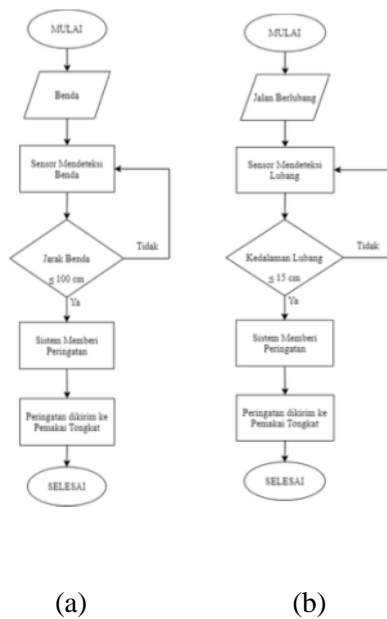
Gambar 2. Diagram alir penelitian (a) mendeteksi benda (b) mendeteksi jalan.

Pengujian dilakukan untuk mengetahui kerja sistem secara keseluruhan, apakah sistem bekerja sesuai dengan metode penelitian yang dilakukan atau tidak. Pengujian dimulai dari pengiriman data hingga penerimaan data secara keseluruhan.