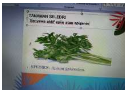
Gambar 2 Sledri Mengandung Senyawa Apiin Untuk Anti Hipertensi

Gambar 2. Kegiatan ini memberikan pengetahuan terkait penyakit degeneratif radikal bebas, antioksidan cara kerja antioksidan alami pembuatannya. Pemateri dalam kegiatan ini menyampaikan bahwa antioksidan alami baik dari daun buah herbal dan cara pemanfaatannya.