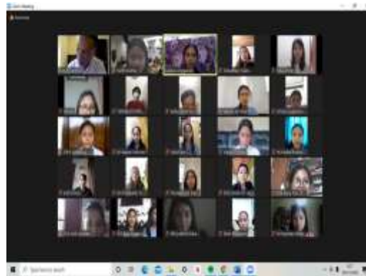
Gambar 1 Peserta Pengabdian Terlihat Dimonitor

Pelaksanaan pemberian penyuluhan informasi obat penyakit degeneratif dan terapi alternatif mengenai pendampingan berupa penyuluhan informasi obat penyakit degeneratif dan terapi alternatif dari bahan alami yang banyak mengandung antioksidan pemanfaatan bahan alami dapat dilihat pada Gambar 1. Kegiatan ini memberikan pengetahuan terkait penyakit degeneratif radikal bebas, antioksidan cara kerja antioksidan alami pembuatannya. Pemaeteri dalam kegiatan ini menyampaikan bahwa antioksidan alami baik dari daun buah herbal sangat bermanfaat dalam : mencegah radikal bebas, mengurangi kasus penyakit degeneratif di bawah merupakan kegiatan virtual dengan peserta mahasiswa beserta orang tua sebanyak 65 orang penyuluhan gambar 1