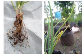
Gambar 2. Tanaman Terserang Layu Fusarium dan Tanaman Terserang Ulat Daun

anorganik dapat meningkatkan pH, KTK tanah, kandungan NPK, kation yang dapat dipertukarkan seperti: Ca, Mg, K, dan Na. Selain itu juga dapat meningkatkan pertumbuhan dan produksi tanaman.