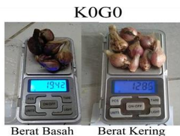
Gambar 3. Perbandingan Perlakuan Berat Basah dan Berat Kering Bawang Merah Tanpa Perlakuan Kompos Daun Kelapa Sawit dan NPK 16.16.16

rata-rata 448 gram untuk empat tanaman bawang merah.