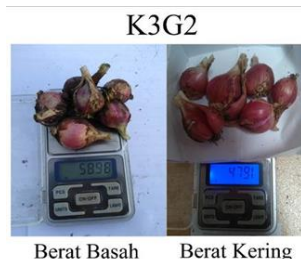
Gambar 4. Perbandingan Berat Basah dan Berat Kering Bawang Merah dengan Perlakuan K3G2 (Kompos Daun Kelapa Sawit 45 gram/polybag dan NPK 16.16.16 1,15 gram/polybag)

serta pupuk K memberikan peran positif dalam menyediakan hara khususnya unsur kalium yang dibutuhkan untuk pertumbuhan umbi bawang merah.