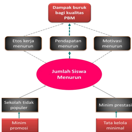
Gambar 1. Analisis Pohon Masalah SMPK Indriyasana VII

menjadi dasar dalam menyusun matrik perencanaan program. Analisis pohon tujuan dalam pengabdian masyarakat ini diskemakan dalam Gambar 2.