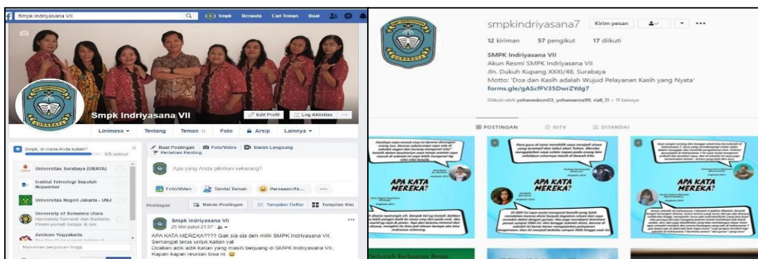
Gambar 5. Akun Media Sosial SMPK Indriyasana VII

Media sosial yang dipilih adalah Facebook dan Instagram. Facebook dan Instagram dipilih karena keduanya memiliki karakteristik yang berbeda sehingga optimalisasi keduanya diharapkan dapat menjangkau segmen yang berbeda tersebut. Akun Facebook di awal baru berupa akun regular. Nantinya akan diubah menjadi Facebook Page agar mempermudah dalam pembuatan iklan secara berkala.