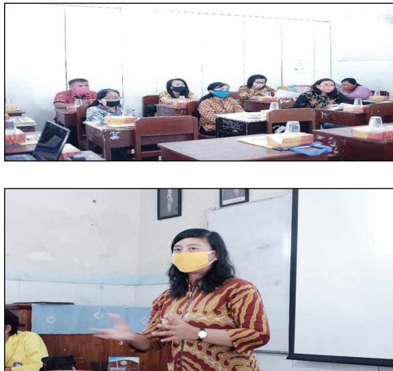
Gambar 6. Bimbingan Teknis di SMPK Indriyasana VII