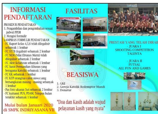
Gambar 4. Brosur SMPK Indriyasana VII