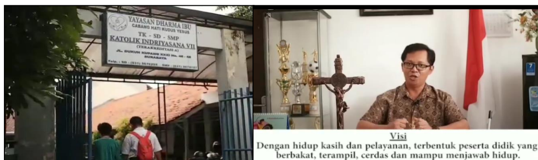
Gambar 3. Video Profil SMPK Indriyasana VII