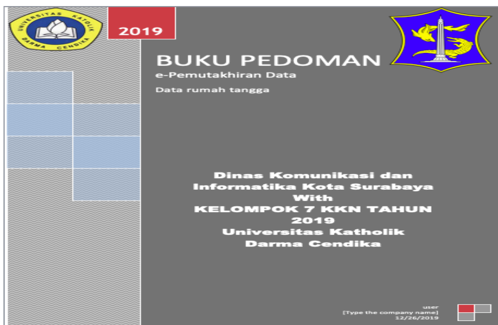
Gambar 3. Buku Pedoman