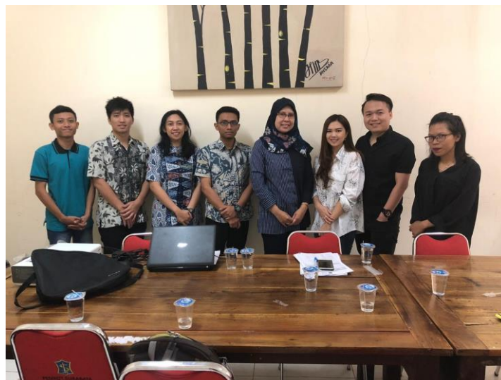
Gambar 2. Pertemuan Dengan Dinas Sosial

Berdasarkan hal itu maka kerangka pemecahan masalah yang dapat dilakukan pada Program Pengabdian Masyarakat Mahasiswa di Dinas sosial Surabaya Bagian Pendataan yang tercantum pada Tabel 1.2. sebagai berikut: