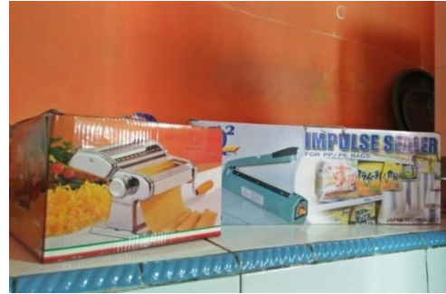
Gambar 2 Peralatan Penunjang