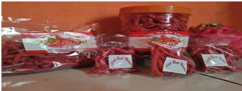
Gambar 3 Hasil Produksi

Memberikan pengetahuan tentang manajemen pemasaran yang baik, serta pemanfaatan media social untuk menunjang pemasaran digital ( digital marketing ). Pelatihan manajemen pemasaran dalam program pengabdian ini juga sederhana, yaitu memberikan pengetahuan tentang target konsumen serta cara memasarkan produknya ke target konsumen. Target konsumen yang cukup luas bisa didapatkan dengan memanfaatkan media social baik FB, Instagram, whatsapp dan lain-lain. selain menysasar konsumen secara luas, juga harus bisa memanfaatkan peluang yang masih terbuka lebar yaitu masyarakat sekitar, karena didaerah Tembokrejo ada banyak yayasan pendidikan mulai dari TK sampai SMA yang didalamnya banyak pelajarnya. untuk konsumen setingkat pelajar, UMKM ini menjual produknya yang harganya 1000. kemudian untuk produk yang ukurannya besar bisa dijual secara online, dan bisa dititipkan di toko-toko yang ada di desa Tembokrejo maupun diluar desa. Dalam program pengabdian ini, kami juga membuatkan sticker yang ditempelkan di