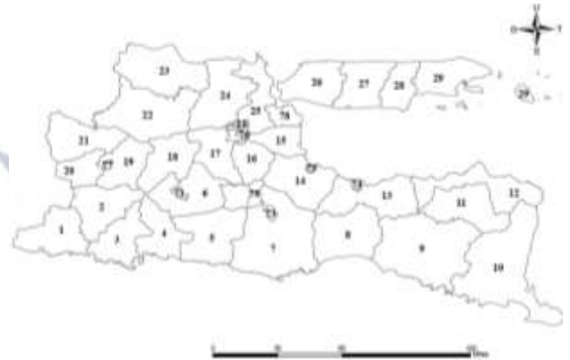
Gambar 2. Peta Jawa Timur

Pada Gambar 2 dapat dibuat matriks pembobot spasial yang digunakan adalah Rook Contiguity (persinggungan sisi). Berikut bentuk dari matriks pembobot spasial Rook Contiguity berukuran 38x38.