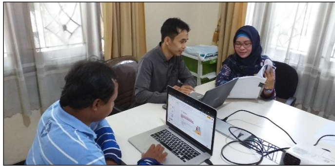
Gambar 6. Instruktur Memberikan Pengarahan dan Contoh

Pelaksanaan pelatihan dengan cara instruktur menjelaskan dan mempraktekkan materi, kemudian peserta pelatihan mendengarkan dan mempraktekkan langsung materi yang disampaikan instruktur dengan didampingi oleh tim pengabdian yang lain serta mahasiswa sebagai asisten pelatihan. Instruktur pelatihan selain menjelaskan dan mempraktekkan juga memberikan contoh-contoh yang dengan mudah dipahami oleh peserta dan dapat diikuti serta dipraktekkan oleh peserta (Gambar 6). Tim pengabdian sebagai instruktur pelatihan memberikan soal studi kasus yang harus dikerjakan oleh peserta pelatihan. Selain itu juga kasus-kasus proyek yang selama ini ditangani oleh tim analis juga menjadi bahan diskusi penyelesaian masalah dalam kegiatan pengabdian. Hal ini juga untuk mengurangi kejenuhan bagi peserta pelatihan. Jika semua peserta telah selesai mempraktekkan dan tidak ada pertanyaan yang disampaikan maka instruktur akan melanjutkan materi berikutnya. Begitu seterusnya hingga materi selesai dan dilanjutkan dengan bahasan materi yang berbeda oleh instruktur yang berbeda sampai semua materi selesai disampaikan ke peserta pelatihan.