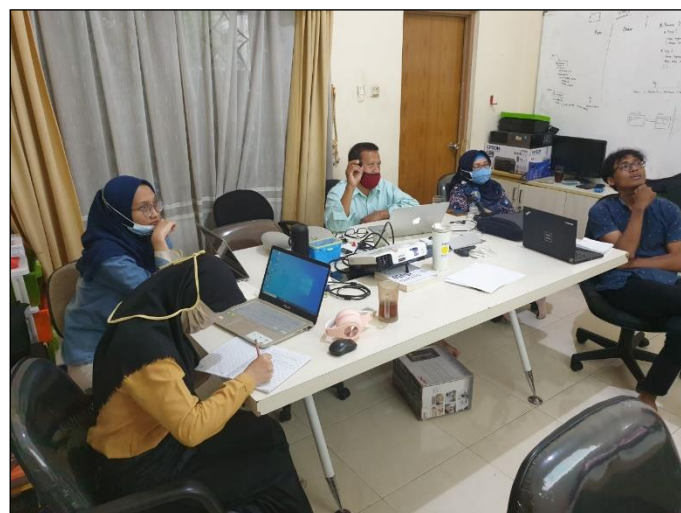
Gambar 4. Peserta Mengikuti Penjelasan dan Mempraktekkan