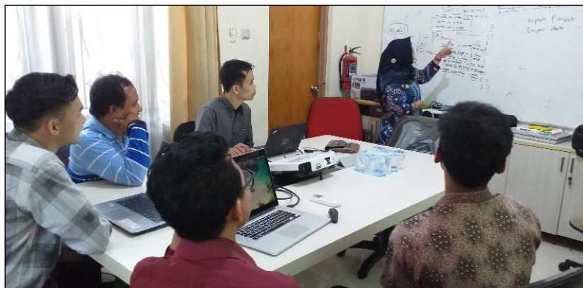
Gambar 3. Tim Pengabdian Menyampaikan Materi

Bentuk pelaksanaan Kegiatan Pengabdian Kepada Masyarakat yang dilakukan untuk Tim Analisis Sistem PT. TAS ini dilakukan dengan cara pelatihan kepada peserta. Pelatihan dilakukan dengan memberikan materi konsep dan teori secara langsung kepada peserta (Gambar 3). Selanjutnya peserta juga diberikan pelatihan menggunakan software perancangan yang dapat langsung dipraktekkan. Peserta pelatihan dengan menggunakan komputer/laptop yang mereka miliki untuk sarana bekerja dapat langsung mempraktekkan materi yang diberikan saat pelatihan (Gambar 4) Penyampaian materi pelatihan dilakukan dengan cara memberikan pengetahuan dan informasi secara langsung contoh-contoh kasus sistem dan juga kasus-kasus yang selama ini ditangani oleh peserta pelatihan di pekerjaan yang selama ini ditekuni dan harus dikerjakan. Dengan demikian maka pelatihan langsung menyelesaikan kasus-kasus yang selama ini menjadi permasalahan dalam pekerjaan peserta pelatihan. Pelatihan dilakukan dengan menggunakan perangkat Komputer berupa laptop dari yang dimiliki oleh peserta dan juga merupakan fasilitas kantor yang diberikan oleh PT. TAS Semarang untuk fasilitas kerja tim analisis sistem yang dalam hal ini sebagai peserta pelatihan pengabdian masyarakat.