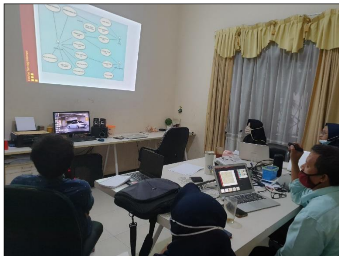
Gambar 5. Tim Pengabdian Mempraktekkan Software Enterprise Architect

Peserta pelatihan menerapkan materi yang disampaikan tim pengabdian dengan membuat perancangan dari kasus dengan dibuat diagram use case , class dan activity diagram , serta mempraktekkan software enterprise architect untuk membuat diagram-diagram tersebut. Peserta sangat antusias dalam mengikuti pelatihan yang diberikan, karena materi yang diberikan merupakan materi yang dibutuhkan untuk penyelesaian pekerjaan mereka sehari-hari di PT. TAS Semarang nantinya. Dengan pengetahuan dan keterampilan yang diberikan peserta semakin termotivasi dalam bekerja dan menyelesaikan tugas sehingga dokumentasi yang dihasilkan dapat lebih terstruktur dengan baik dan memenuhi kaidah-kaidah yang benar.