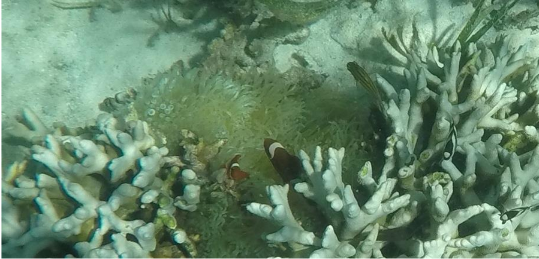
Gambar 2. Porites sp. bercabang dan anemon laut ( Entacmea quadricolor ) sedang mengalami bleaching , dihuni oleh P. kauderni , Premnas biaculeatus , Dascyllus aruanus

Data yang diperoleh menunjukkan bahwa sebagian besar jenis karang yang dilaporkan sebagai mikrohabitat P. kauderni masuk dalam kategori relatif rentan terhadap dampak perubahan iklim; demikian pula mikrohabitat anemone laut, hewan yang juga bersimbiosis dengan zooxanthellae. Riset dampak perubahan iklim terhadap jenis-jenis anemon laut simbiosis P. kauderni masih minim; mengingat peran pentingnya pada fase juvenil P. kauderni (Moore dkk., 2012), dipandang sebagai salah satu prioritas penelitian.