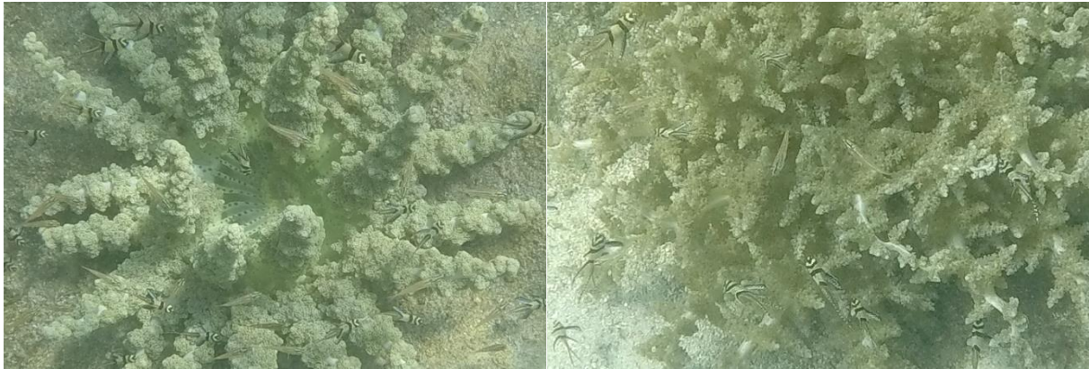
Gambar 3. Juvenil P. kauderni berasosiasi dengan Actinodendron sp. di Bone Baru