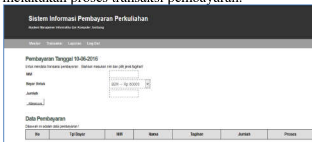
Gambar 4 : Halaman Input Pembayaran

Halaman input pembayaran digunakan untuk melakukan proses transaksi pembayaran.