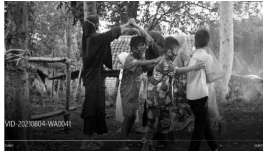
Gambar 7. Permainan oray – orayan

Sebagai ilustrasi anak usia SD sedang beraktivitas permainan sodah seperti di tampilkan pada gambar 8.