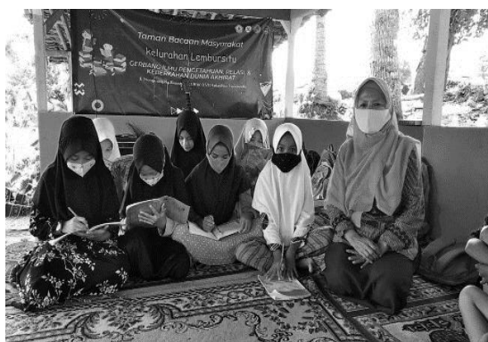
Gambar 6. Anak didik SD/MI belajar daring

pembelajaran daring ( online ), selama terjadinya pandemi covid-19 . Pengurus TBM Hibar Endah merasa terpanggil musibah yang melanda dunia termasuk Indonesia, perubahan aktivitas pembelajaran seluruh jenjang pendidikan termasuk SD/MI secara tiba-tiba untuk melakukan pembelajaran dari rumah melalui media daring ( online ), sementara pelaksanaan pembelajaran tetap berjalan. Maka dari itu, pemikiran yang positif, kreatif dan inovatif para pemuda yang didukung dan dipantau pengurus TBM Bojongloa membantu mengatasi berbagai problematika dalam proses pembelajaran jarak jauh dengan menerapkan media pembelajaran daring yang menyenangkan, sehingga menghasilkan capaian pembelajaran yang tetap berkualitas. Sesuai dengan pendapat Jaelani dkk (2020), mengatakan bahwa pembelajaran jarak jauh dengan menggunakan media daring diharapkan siswa bisa mengikuti pembelajaran dengan maksimal. Dalam hal ini dijelaskan pada gambar bahwa anak didik SD/MI belajar daring yang dibimbing oleh para remaja seperti diterangkan pada gambar 6.