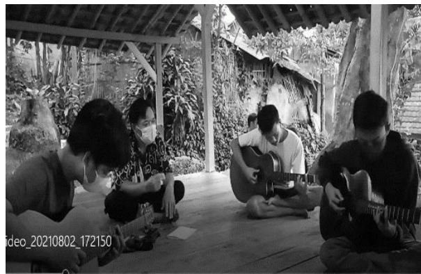
Gambar 9. Permainan gitar

KUTEMBANG adalah Kumpulan Terampil Bermain Gitar KUTEMBANG adalah Kumpulan Terampil Bermain Gitar seperti datampilkan pada gambar 9.