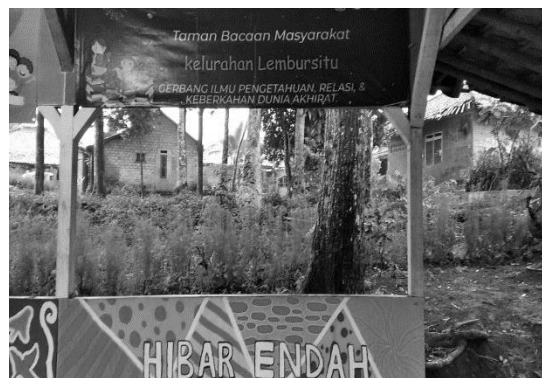
Gambar 3. Site Plan Eksisting

Responden terkait Taman Bacaan Masyarakat Hibar Endah merupakan lembaga yang menyelenggarakan, menyediakan fasilitas bahan bacaan karena keberadaan TBM sangat penting sebagai sarana belajar, khususnya warga belajar (pelajar, mahasiswa) dan umumnya bagi masyarakat agar gemar belajar, gemar membaca dan menulis.