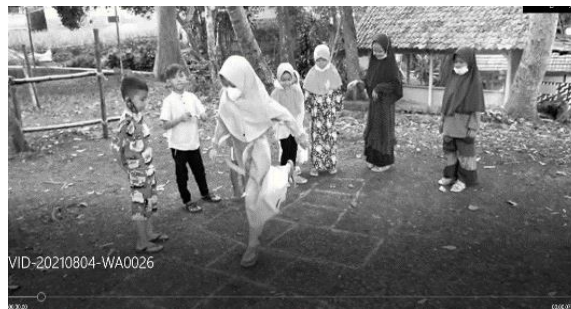
Gambar 8. Permainan Sondah

Sebagai ilustrasi anak usia SD sedang beraktivitas permainan sodah seperti di tampilkan pada gambar 8.