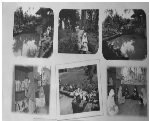
Gambar 10. Diajar manggung

Berdasarkan uraian simpulan di atas, dapat diberikan saran- saran sebagai berikut. Pertama , TBM merupakan lembaga yang menyediakan bahan bacaan yang dibutuhkan masyarakat sebagai tempat penyelenggaraan pembinaan kemampuan membaca dan belajar. Selain itu, TBM juga merupakan tempat yang digunakan untuk mendapatkan informasi bagi masyarakat, khususnya yang bersumber dari bahan pustaka, yang harus dilaksanakan sebaik-baiknya. Kesungguhan, komitmen, kerja keras dan kerja sama dari pengurus TBM, para tokoh masyarakat, dan warga masyarakat secara keseluruhan merupakan kunci utama bagi perwujudan dari apa yang telah direncanakan sehingga TBM Hibar Endah menjadi lebih menyenangkan, menantang, mencerdaskan, dan sesuai dengan keadaan di masyarakat Bojongloa. Kedua , para tokoh masyarakat dan lembaga-lembaga berkepentingan harus dapat melaksanakan evaluasi secara informal terhadap dokumen TBM maupun pelaksanaannya. Evaluasi tersebut yang harus dipahami kemampuan literasi dasar (pemahaman, ketrampilan, dan sikap serta prilaku) yang tertulis cukup lengkap untuk merespon keadaan kebutuhan masyarakat. Para tokoh masyarakat sebagai pengembang sekaligus sebagai penanggungjawab TBM harus mampu mengembangkan literasi dasar masyarakat (pemahaman, ketrampilan, dan sikap serta prilaku). Semua kebijakan harus dijalankan secara berkesinambungan dan didukung seluruh elemen termasuk masyarakat itu sendiri.