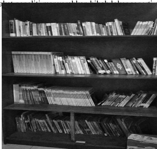
Gambar 5. Hibah Loker dari Peneliti

Kedua , Lemari buku (loker) adalah tempat untuk menyimpan buku perpustakaan agar tertata rapih sebagai pengabdian masyarakat. Lemari buku (loker) yang telah dibuat dan diserahkan literangkan pada gambar 5.