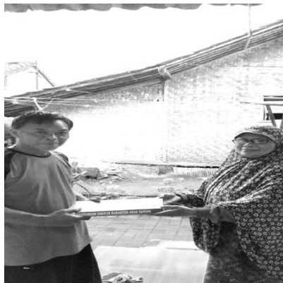
Gambar 4. Serah terima Buku

Hibah buku sebagai pengabdian masyarakat yang kepada TBM Hibar Endah berikut adalah serah terima terima buku antara peneliti dan ketua TBM Hibar Endah.