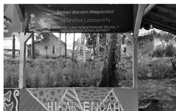
Gambar 1. Kondisi TBM Hibar Endah

Berdasar latar belakang di atas dapat diambil kesimpulan bahwa keberadaan TBM sangat penting sebagai sarana belajar untuk membangkitkan dan meningkatkan minat baca, khususnya warga belajar (pelajar, mahasiswa) dan umumnya bagi masyarakat yang merupakan tempat digunakan untuk mendapatkan informasi khususnya yang bersumber dari bahan pustaka. TBM dan ketersediaan bahan bacaan yang bermutu bertujuan untuk meningkatkan minat baca dan budaya baca masyarakat. Dalam hal ini untuk kecintaan ilmu pengetahuan dibutuhkan dukungan, dorongan, dan motivasi pihak keluarga, sekolah sampai dengan tokoh masyarakat. Masyarakat secara umum, pemerintah, dan lembaga sosial kemasyarakatan. Sebagai ilustrasi TBM Hibar Endah ini seperti di ditampilkan pada gambar 1.