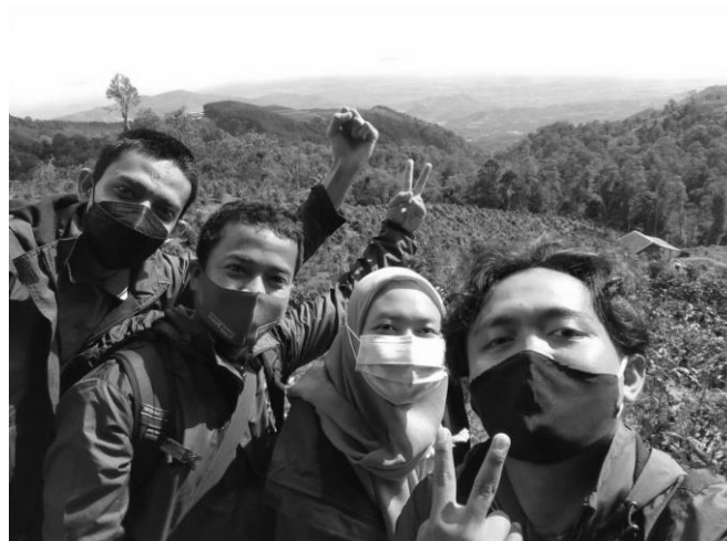
Gambar 4. Kunjungan ke perkebunan kopi plasma milik warga