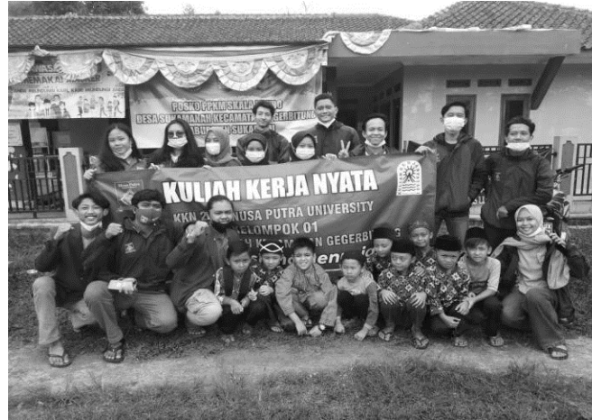
Gambar 2. Kegiatan Bersama Dosen Pembimbing

Pelaksanaan program pemberdayaan masyarakat di desa Sukamanah terbagi dalam tiga bidang yakni bidang sosial, bidang pendidikan, dan bidang teknologi. Semua kegiatan terdokumentasikan dalam foto foto berikut ini :