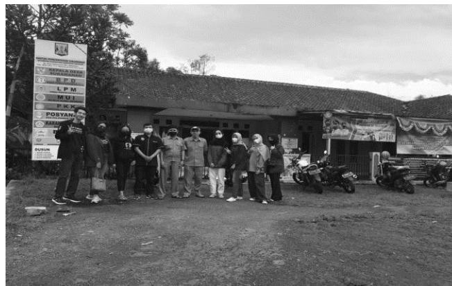
Gambar 3. Membersihkan Mesjid