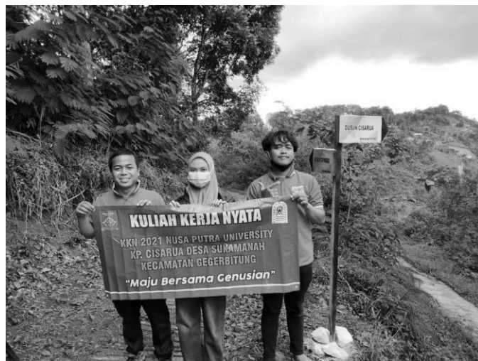
Gambar 6. Sosialisasi ke masyarakat