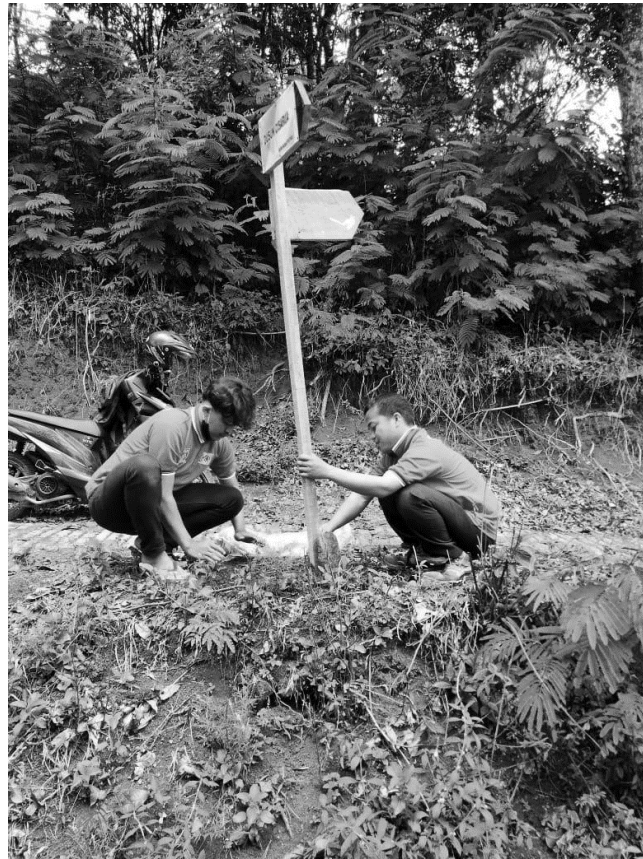
Gambar 5. Pemasangan papan petunjuk arah