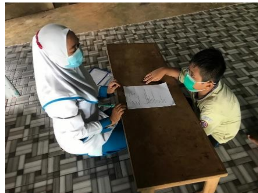
Gambar 4 Pengisian kuesioner post-test

Dilanjutkan dengan sesi diskusi tanya jawab (gambar 3). Menurut Oktarianita et al., (2021) sesi tanya jawab kegiatan bertujuan untuk mengetahui sejauh mana remaja telah memahami materi yang telah disampaikan seputar kesehatan remaja. Penyuluhan kegiatan yang dilakukan memerlukan alat bantu, alat bantu penyuluhan dapat berupa media video. Menurut Madanih et al., (2019) alat bantu penyuluhan yang digunakan supaya mudah dipahami dalam menyampaikan materi. Alat bantu dapat berupa video tentang cara mencuci tangan yang efektif. Karena dengan bantuan video yang bersifat audiovisual ini siswa akan lebih mudah memahami dan mempraktikkan mencuci tangan (gambar 5).