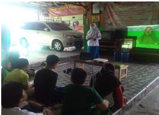
Gambar 3 sesi tanya jawab

menjaga jarak, menjauhi kerumunan, mengurangi mobilitas interaksi fisik dan tidak hanya itu saja pemerintah juga mengajak semua masyarakat untuk berperan langsung dalam pencegahan Covid-19 dengan cara selalu menerapkan protokol kesehatan.