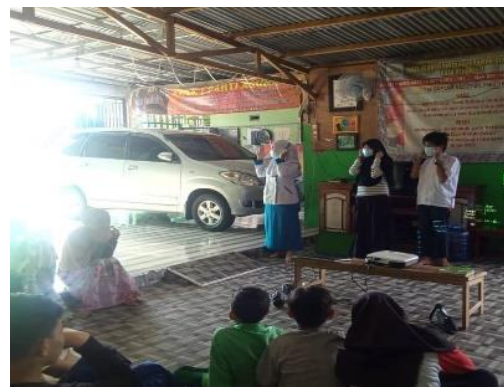
Gambar 2 Penyampaian materi pencegahan Covid-19

Tahap pertama pelaksanaan kegiatan adalah pengisian kuesioner pretest (gambar 1) Selanjutnya diberikan penyuluhan dengan metode ceramah melalui video 5M edukasi seputar pencegahan Covid-19 (gambar 2). Sebelum memulai kegiatan dilakukan doa bersama untuk kelancaran kegiatan selanjutnya ketua pelaksana/ pengabdian menyampaikan maksud dan tujuan kegiatan, yang dilanjutkan dengan penyampaian materi edukasi pengetahuan pencegahan Covid-19. Adapun informasi kesehatan yang diberikan adalah pengertian Covid-19, cara pencegahan Covid-19 yang dihadapi sekarang di antaranya dengan cara mencuci tangan, memakai masker,