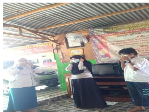
Gambar 6 Praktik pencegahan Covid-19 dengan menggunakan masker

Pendidikan kesehatan bertujuan agar orang mampu menerapkan masalah dan kebutuhan mereka sendiri, mampu memahami apa yang dapat mereka lakukan terhadap masalahnya, dengan sumber daya yang ada pada mereka ditambah dengan dukungan dari luar, dan mampu memutuskan kegiatan yang tepat guna untuk meningkatkan taraf hidup sehat dan kesejahteraan masyarakat ( Mubarak 2012 ).