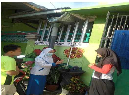
Gambar 5 Praktik pencegahan Covid-19 dengan mencuci tangan

Dilanjutkan dengan sesi diskusi tanya jawab (gambar 3). Menurut Oktarianita et al., (2021) sesi tanya jawab kegiatan bertujuan untuk mengetahui sejauh mana remaja telah memahami materi yang telah disampaikan seputar kesehatan remaja. Penyuluhan kegiatan yang dilakukan memerlukan alat bantu, alat bantu penyuluhan dapat berupa media video. Menurut Madanih et al., (2019) alat bantu penyuluhan yang digunakan supaya mudah dipahami dalam menyampaikan materi. Alat bantu dapat berupa video tentang cara mencuci tangan yang efektif. Karena dengan bantuan video yang bersifat audiovisual ini siswa akan lebih mudah memahami dan mempraktikkan mencuci tangan (gambar 5).